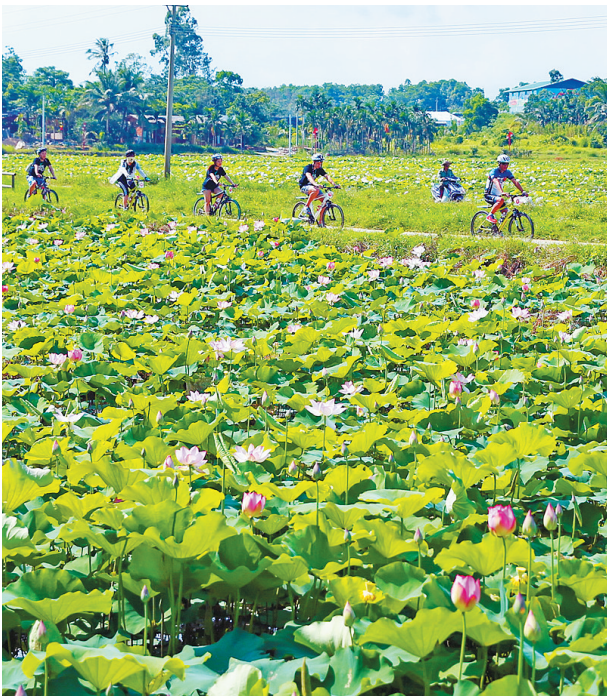
龙寿洋百亩荷花已盛放，引来游客骑行观赏。

龙寿洋万亩田野公园总占地面积13218亩，总体规划充分利用水利渠道，青绿成趣，以农耕文化、侨乡文化、红色文化和会议文化为核心，对标荷兰羊角村。水城文化贯穿整个项目，通过“大旅游区+特色小镇+美丽乡村”的主体思路，项目规划建设为田园拾穗、田园四季、田园野趣、田园养身、田园雅舍、田园嘉年华六个区域。