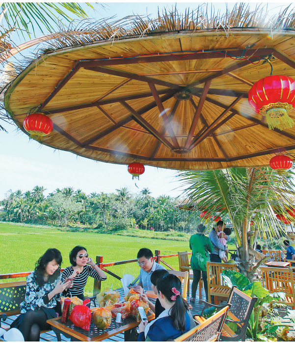
游客在琼海龙寿洋万亩田野公园游玩。