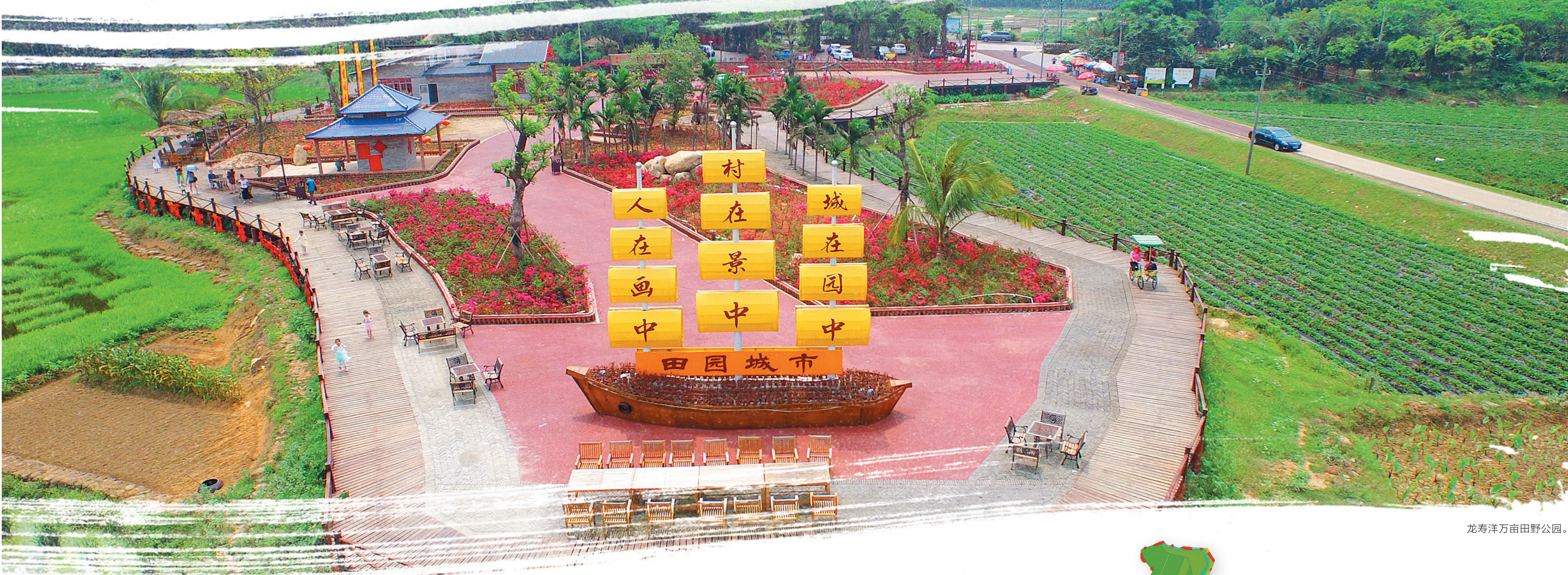
龙寿洋万亩田野公园。

在乡村振兴战略背景下启动的龙寿洋新一轮建设中，更加注重了在原来建设基础上的产业提升，如目前已经确定的兰花、佛手莲等具有高附加值、又能够很好结合农、旅特色的产业，以及与博鳌乐城国际医疗旅游先行试验区相呼应的预防医学农业项目，产业优势更为突出和明显，能够更好地实现产业振兴，并最终取得持续的效益提升，成为海南乡村振兴的一个新样板。