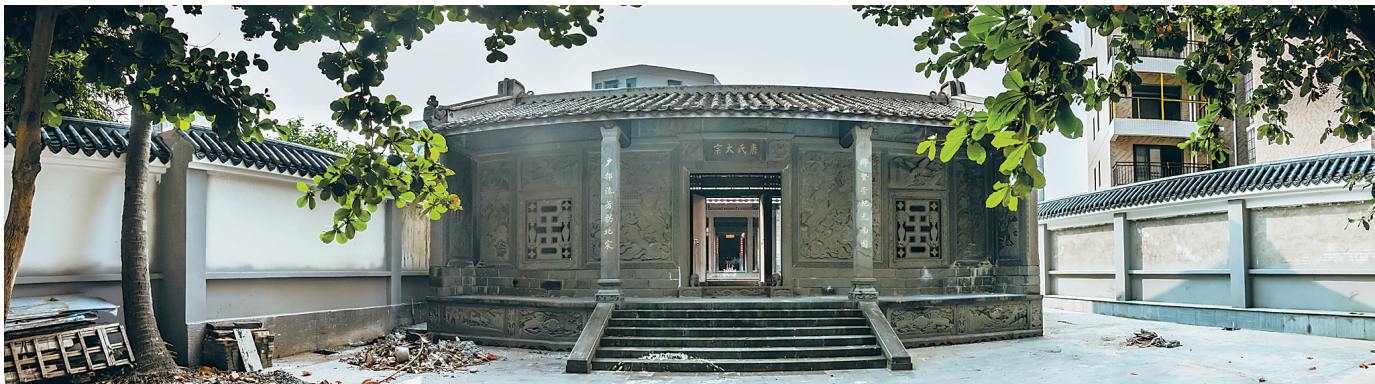
海口市琼山区攀丹村唐氏大宗祠的楹联蕴含着丰富的历史信息。