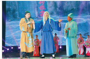
海南工商职业学院近年排演的音乐剧《回望西洲》。