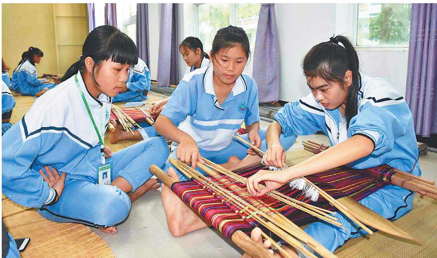
陵水民族中学学生学习黎锦编织。

近年来，在陵水文体局、教科局的牵头组织下，该县目前正在陵水民族中学等11所学校开设“黎锦课堂”，越来越多的学生在校期间就能近距离感受黎锦技艺的魅力。