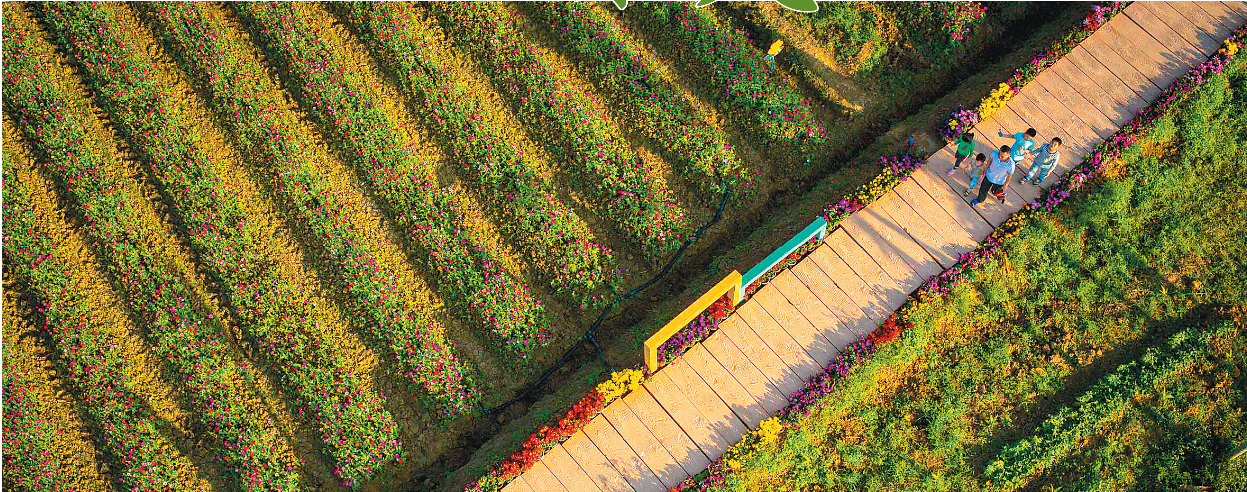
俯瞰琼海市龙寿洋万亩田野公园。

3月31日,距离龙寿洋万亩田野公园不远、被誉为“博鳌亚洲论坛第二乐章”的博鳌乐城国际医疗旅游先行区一片热闹,备受社会瞩目的博鳌超级医院正式开业,一开始就已经吸引了12个顶尖学科的团队入驻。博鳌超级医院的建成,成为医疗卫生领域供给侧结构性改革的一个参考样本,也是海南向建设世界一流医疗旅游目的地迈出的重要一步。