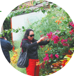
游客到龙寿洋游玩,观赏鲜花,品尝地道的海南农家菜肴。