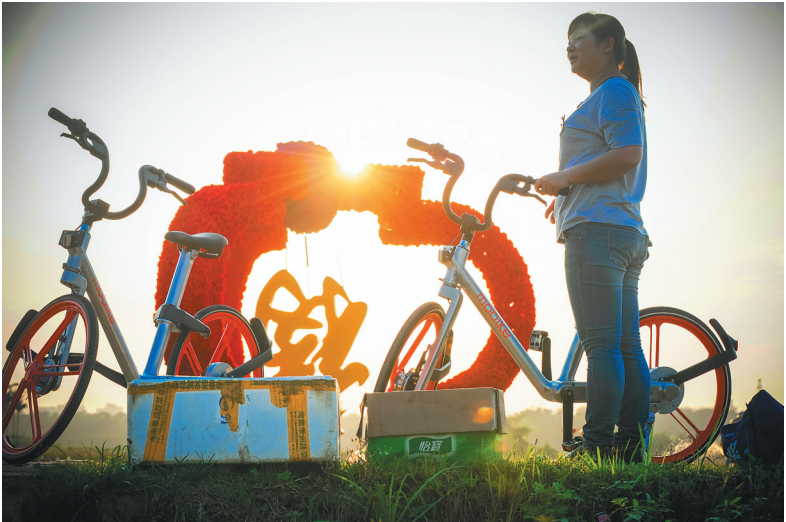
游客骑车游览龙寿洋花海。

先行区国际化的高端医疗设施,与健康小镇建立在预防医学农业基础上的健康产业,让海南的医疗旅游更为国际化和多样化,并能够更好地带动和辐射周边的村庄发展各具特色的乡村康养旅游。