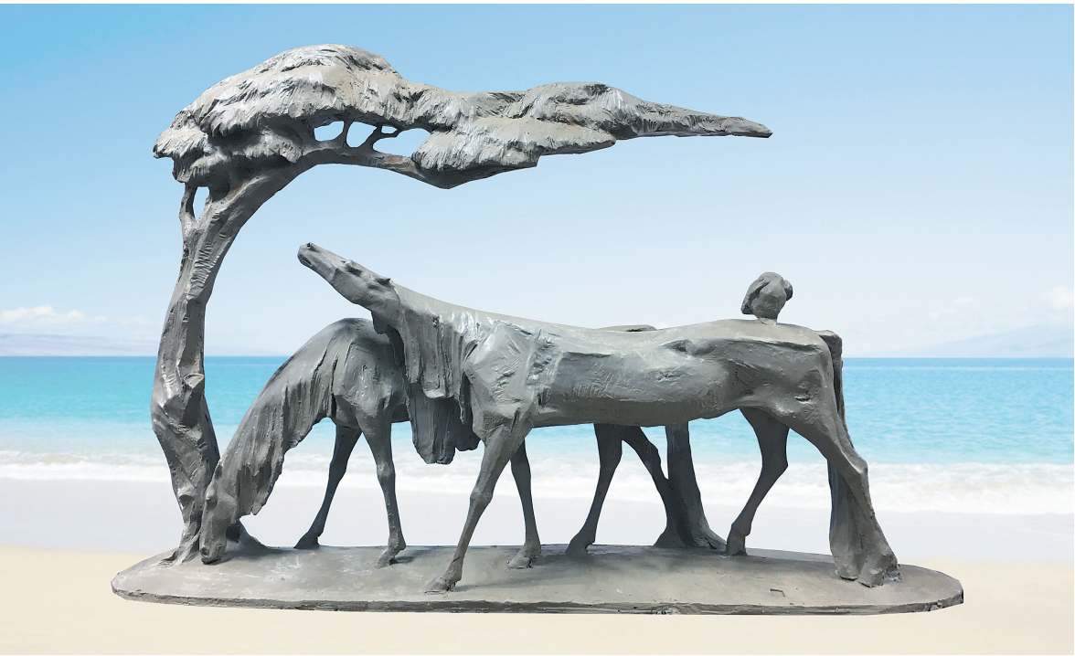
陈健作品《长空横海色》