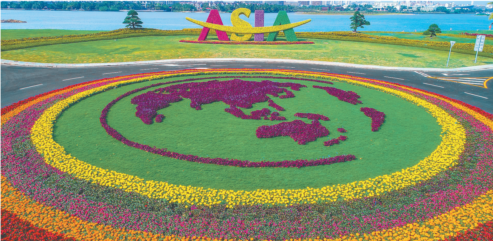
博鳌亚洲论坛会址花团锦簇。

1978年12月安徽凤阳县小岗生产队18户农民按下的18枚鲜红手印，1988年4月26日中共海南省委员会和海南省人民政府正式挂牌的历史一刻，2001年11月11日中国加入世界贸易组织签字仪式现场…… 博鳌亚洲论坛会议中心长廊两侧，主题为“新时代 新征程”的纪念中国改革开放40周年成就视觉展吸引中外嘉宾纷纷驻足。 30多米的长廊如一条时光隧道，一张张照片、一段段视频，将中国改革开放中难忘的历史瞬间定格在世界面前。 “改革开放40年来，我们以敢闯敢干的勇气和自我革新的担当，闯出了一条新路、好路，实现了从‘赶上时代’到‘引领时代’的伟大跨越。”习近平今年初在春节团拜会上的讲话，令人热血沸腾。 40年风雨征程，改革开放创造了令世界赞叹的“中国奇迹”——一分钟，26人走上工作岗位；一分钟，快递小哥收发7.6万件快递；一