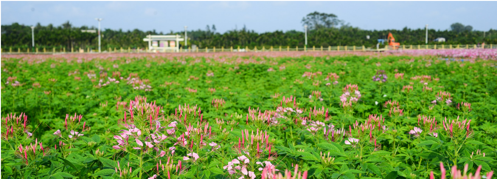
龙寿洋花海。

博鳌亚洲论坛2018年年会开幕前夕，距离龙寿洋万亩田野公园不远，被誉为继博鳌亚洲论坛永久会址落户博鳌之后的“博鳌亚洲论坛第二乐章”——博鳌乐城国际医疗旅游先行区里备受社会瞩目的博鳌超级医院正式开业。博鳌超级医院的建成，让海南朝着建设世界一流医疗旅游目的地目标迈出坚实一步。 而在龙寿洋万亩田野公园的传统田洋里，一项与健康有关的前沿科学正在稳步推进中——即打造预防医学优氧生态农业示范区，这是继绿色农业、有机农业之后，农业产业迎来的又一次革命。 从医疗到预防，从治病到养生，让病痛化解于无形。围绕着打造预防医学农业示范区的目标，龙寿洋以“大区+小镇+新村”旅游发展新模式，以博鳌大旅游区+龙寿洋健康小镇，带动辐射更多周边美丽乡村发展预防医学农业、康养产业等，以更加积极的姿态融入到“博鳌第二乐章”！