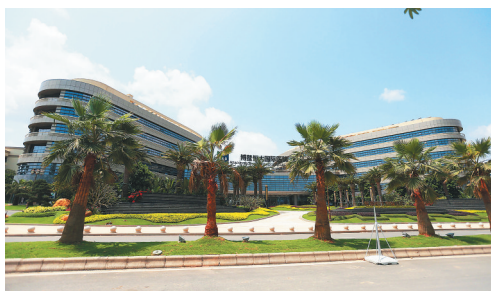
博鳌乐城国际医疗旅游先行区一角。 (本版策划/撰文 杨亦)

医学农业：用医学的概念，针对现代人的亚健康，应用完整的食物链产出多样化的营养物作为植物的养分，经由特选的农作物吸收转化，生产出高质量的农产品，以食补的概念达到营养均衡。如食用一个按照预防医学农业要求生产出来的无病毒百香果，其提供的能量相当于七个苹果。