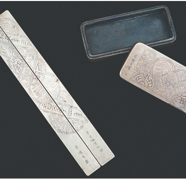
这是彭家珍生前用过的铜墨盒(右)和铜镇纸(资料照片)。