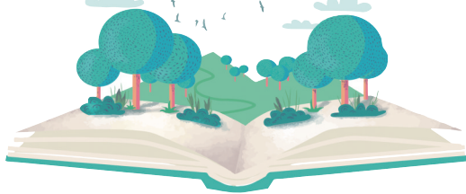
(据新华社4月9日电) 本版制图/孙发强