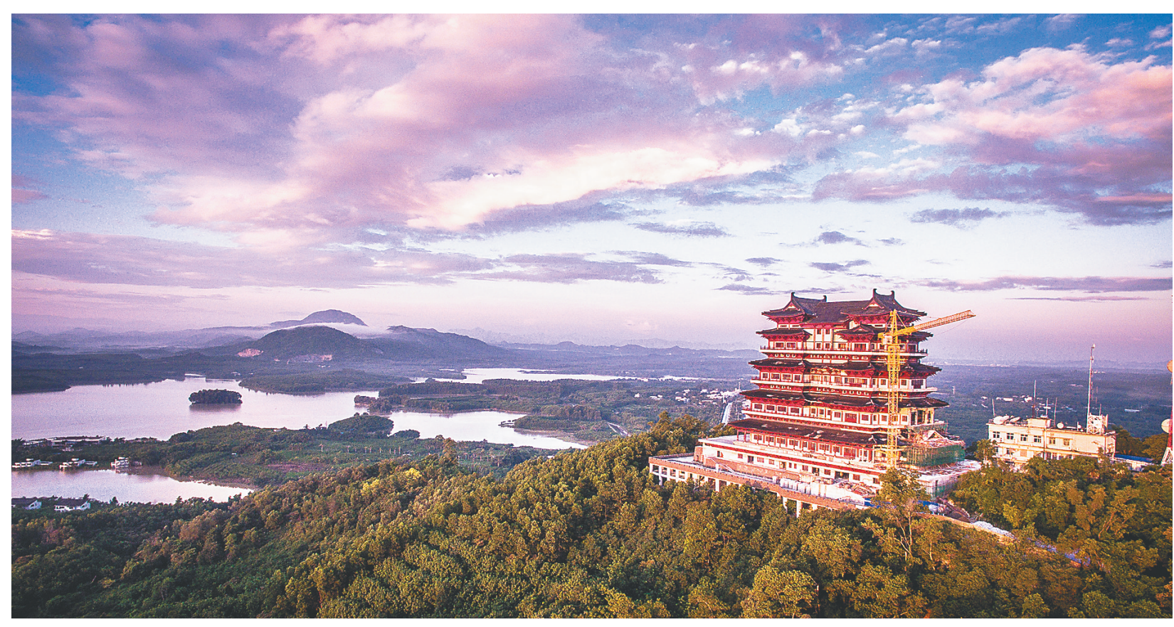
儋阳楼全景。