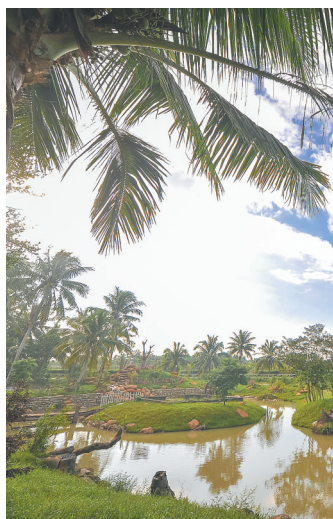
文昌潭牛镇大庙村。

美丽乡村建设,使得美丽的花开遍文昌大地,真是处处皆景,洋溢在村民脸上的笑容很有感染力。(本报文城4月9日电)