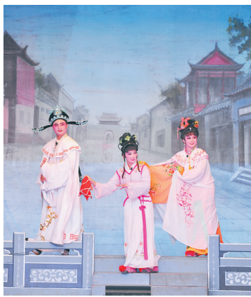
3月31日晚,南洋文化节上,文昌琼剧《状元桥》吸引众多海内外乡亲观看。