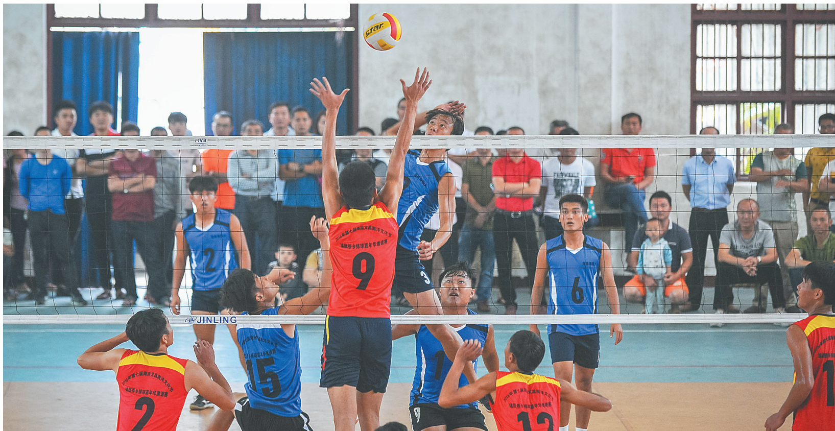
2018年3月31日,文昌中学内一场激烈的排球赛引来十里八乡球迷观看。排球赛是第七届海南文昌南洋文化节的活动之一。