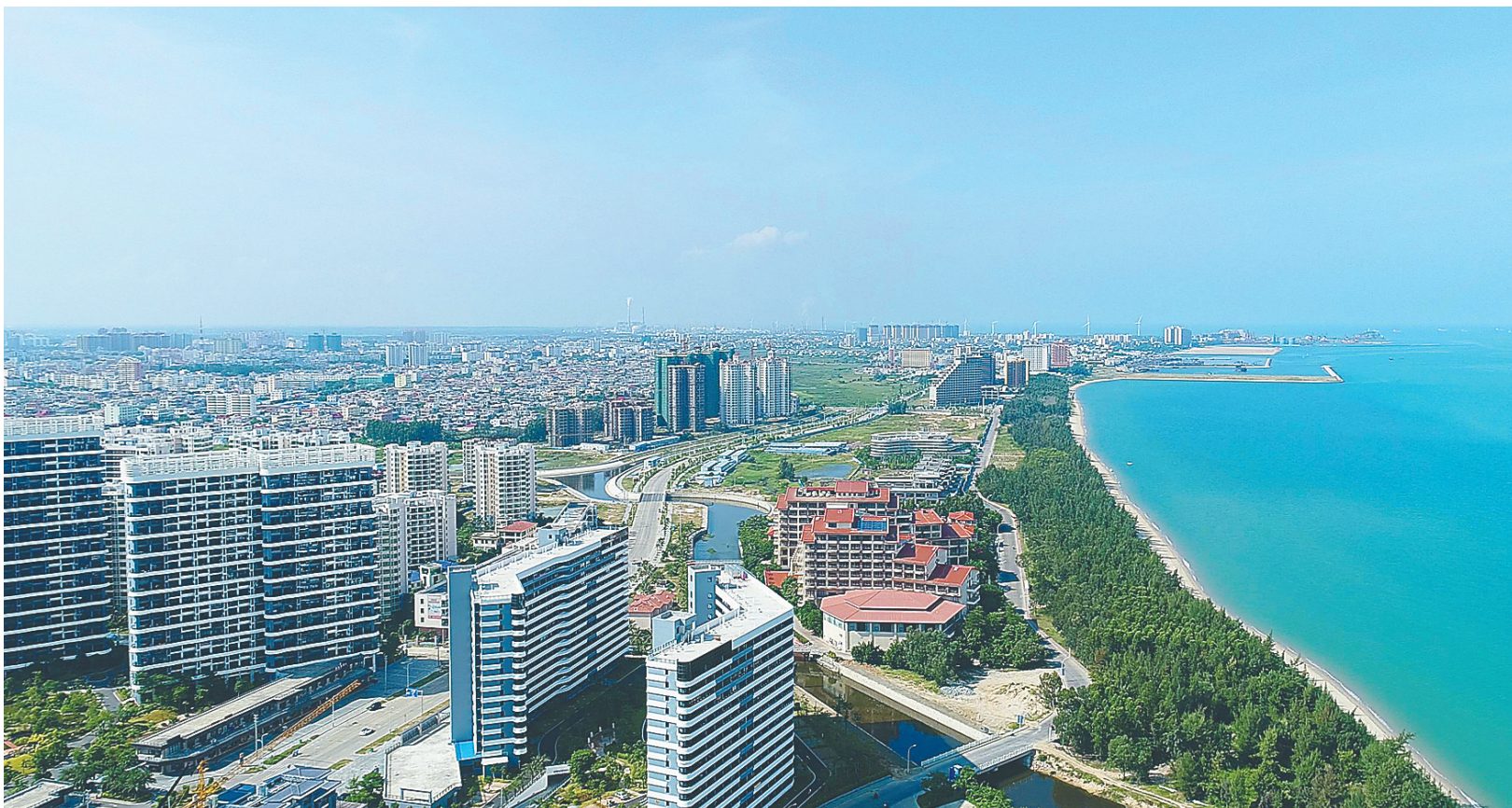
俯瞰东方新城区。