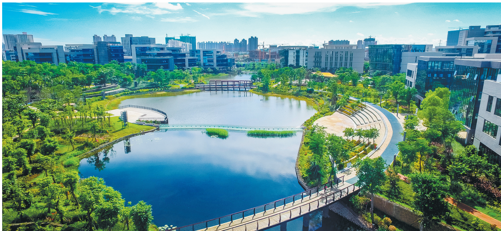
风景如画的海南生态软件园沃克公园。