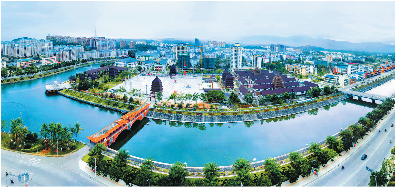
保亭县城风光如画。