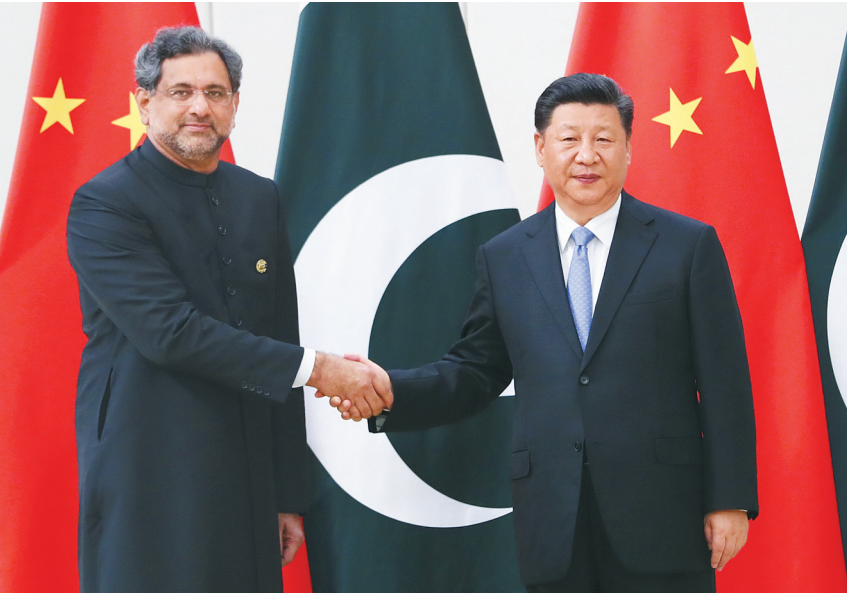
4月10日,国家主席习近平在海南省博鳌国宾馆会见巴基斯坦总理阿巴西。

杆兄弟,在涉及彼此核心利益和重大关切问题上,一贯坚定相互支持。中巴经济走廊建设对巴中两国和地区发展十分重要。巴方愿加强双方金融、能源、农业、基础设施、人力资源等合作。巴方高度评价中国在维护地区和世界和平稳定方