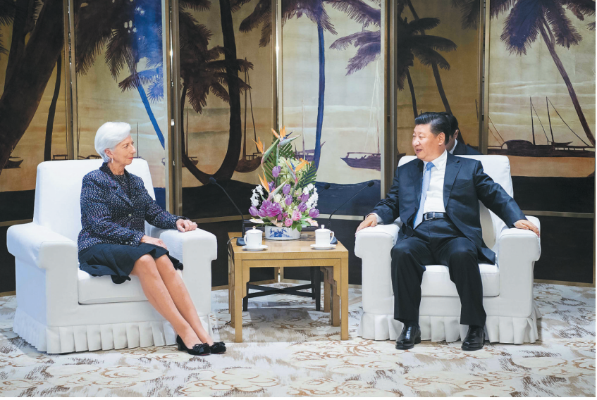
4月10日,国家主席习近平在海南省博鳌国宾馆会见国际货币基金组织总裁拉加德。

拉加德表示,祝贺习近平主席当选连任中国国家主席。我高度赞赏习近平主席今天上午发表的主旨演讲、特别是中国将坚定推进改革开放的积极信息。您的演讲为当今世界增加了确定性和希望。世界需要像中国这样的领导力量。