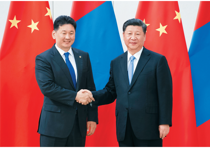
4月10日,国家主席习近平在海南省博鳌国宾馆会见蒙古国总理呼日勒苏赫。

呼日勒苏赫表示,习近平主席今天上午发表的重要演讲给人留下深刻印象,您倡导开放包容的发展为包括蒙古国在内的各国带来更广阔的机遇。加强对华合作是蒙对外政策的优先方向。蒙