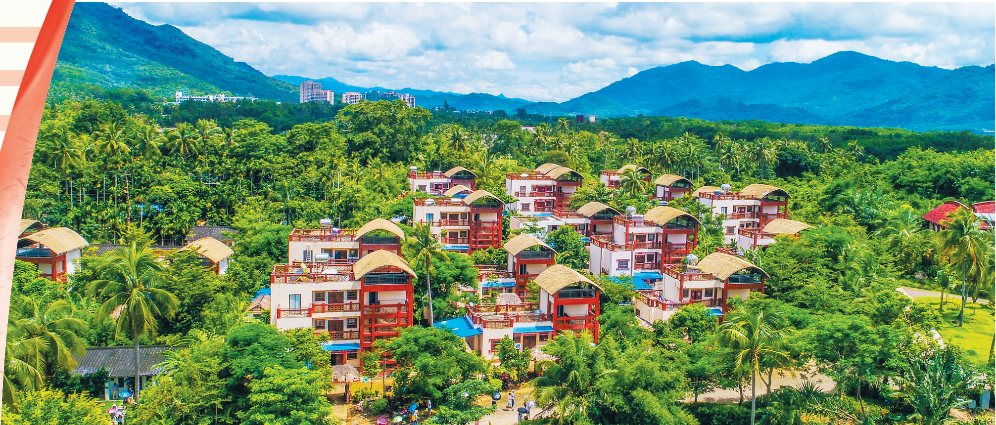
高空鸟瞰保亭黎族苗族自治县布隆赛乡乡村旅游区。