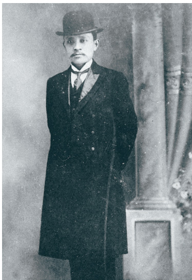
宋教仁像(资料照片)。