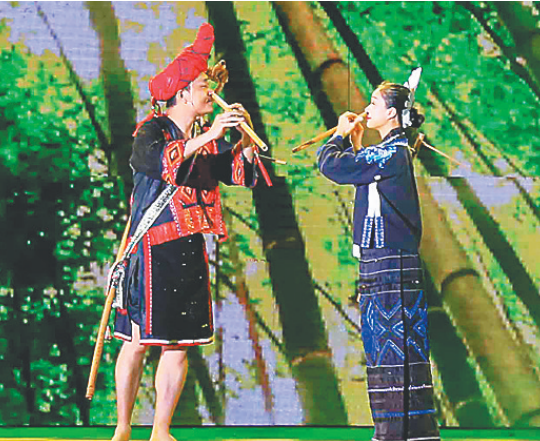
每年的“三月三”主题晚会都是一大亮点，图为2017年琼中“三月三”主题晚会。