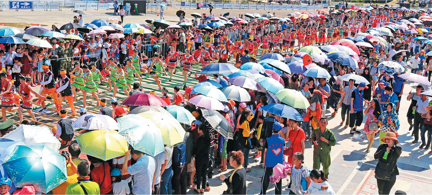
每年“三月三”期间，琼中群众都会同跳竹竿舞，共庆佳节。图为2017年“三月三”期间，琼中群众跳竹竿舞的场景。

“三月三”是海南黎族苗族重要的传统节日。正逢海南建省办经济特区30周年之际，由中共琼中黎族苗族自治县委员会、琼中黎族苗族自治县人民政府主办的2018年纪念海南建省办经济特区30周年暨海南黎族苗族传统节日“三月三”琼中分会场节庆活动，已于4月1日拉开序幕。