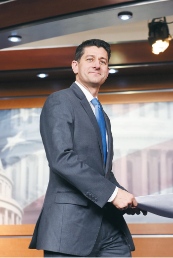
11日，美众议院议长保罗·瑞安在新闻发布会现场。 新华社发

麦哲伦海山上水螅珊瑚的水螅虫。 中国“科学”号科考船考察队日前在海底1400米左右的西太平洋麦哲伦海山上发现了“珊瑚林”，其中最大一株珊瑚高达2米多，这在热带西太平洋的海底十分罕见。 新华社发