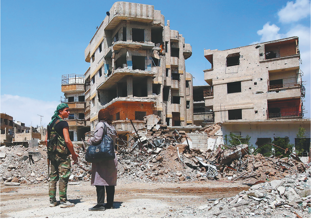
4月11日，在大马士革东古塔地区，一名叙利亚政府军士兵和一名当地女子交谈。

日分别给安理会五个常任理事国的驻联合国代表打电话，重申对当前局势的担忧，强调必须避免局势失控。 东古塔地区是叙利亚反政府武装在叙首都大马士革周边的最后据点。叙反政府武装先多次指责政府军在这一地区使用化学武器，均遭叙政府方面否认。