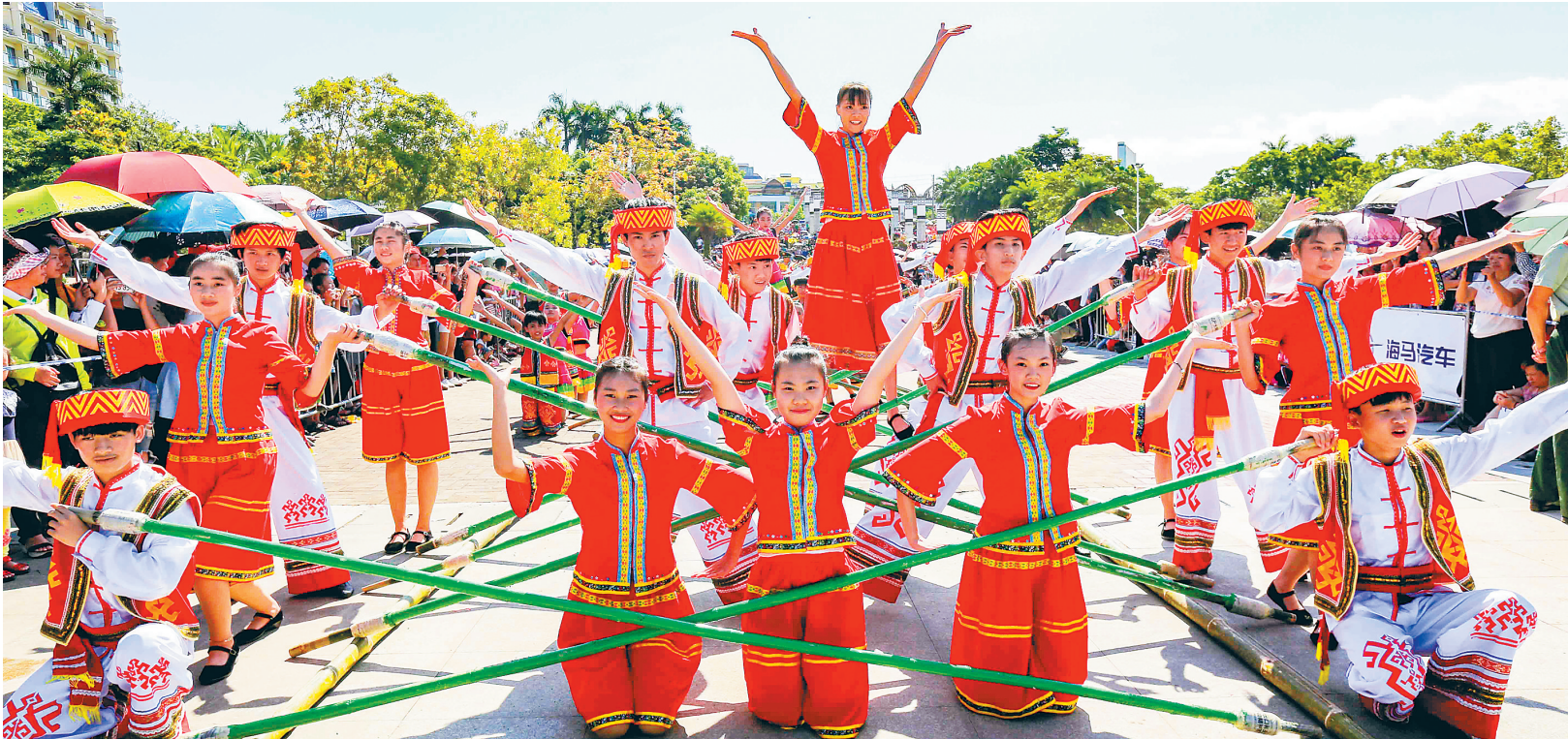
跳竹竿舞是琼中黎族苗族自治县传统节日“三月三”的系列活动之一。图为2017年“三月三”，琼中举办的万人齐跳竹竿舞表演。

独乐乐不如众乐乐。近年来，琼中“三月三”活动不再仅限于歌舞活动，而是与旅游推介融合起来，推广