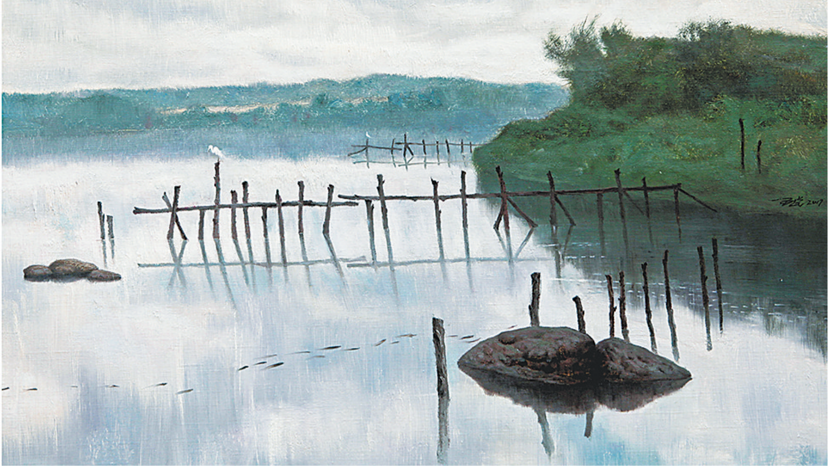
《水鸟的天空》(油画) 王锐(海南)

4月14日,为庆祝海南建省办经济特区30周年,“美丽中国·诗意陵水——中国油画名家走进陵水写生作品展”在陵水开幕,美丽中国的海南画卷在此拉开——