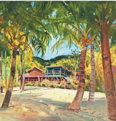
《陵水冬季的阳光》 翁凯旋(重庆)