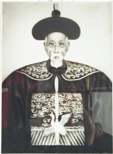
海口府城西厢达士巷王国宪故居里的王承烈画像。

所谓“建安高七子,典午薄三张”,说的是历代诗家认为,“建安七子”(孔融、陈琳、王粲、徐干、阮瑀、应玚、刘桢)与“三曹”(曹操、曹丕、曹植)是汉末三国文学成就的代表。“典午”指晋朝,与魏晋文学相比,“三张”(张载、张协、张元)屈尊一筹。