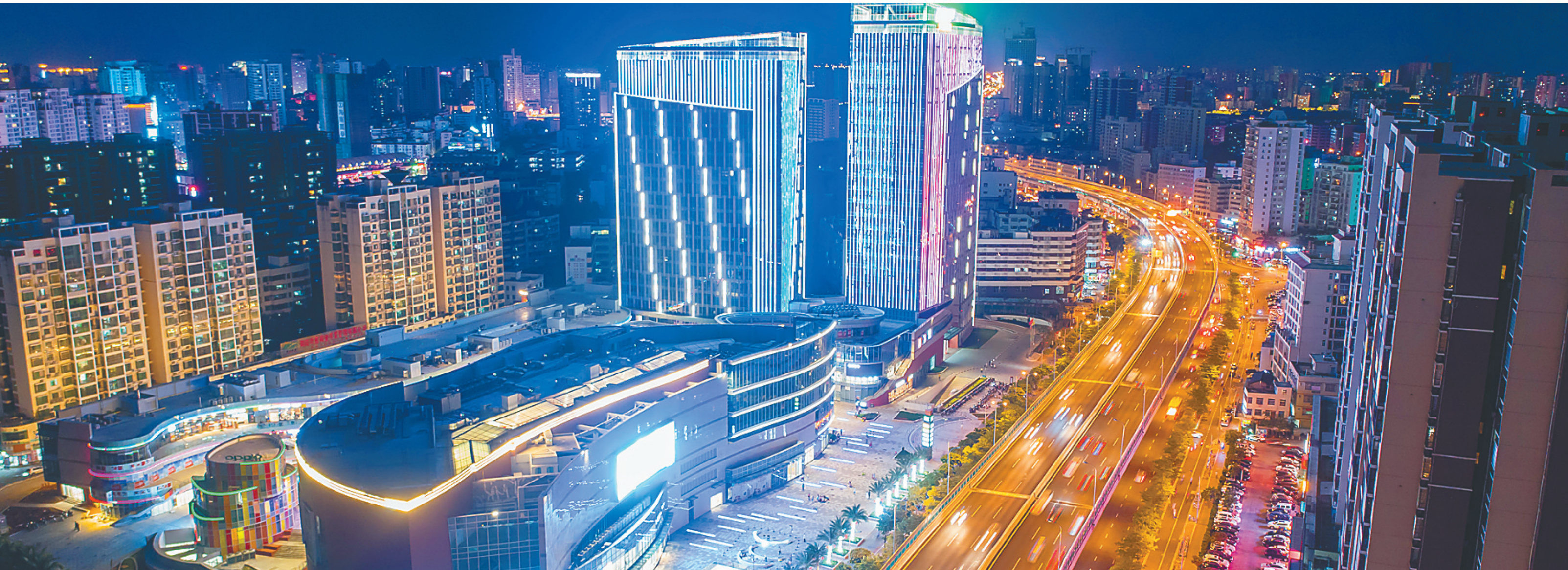
近年来海南农垦不断优化产业结构，进军旅游、商贸物流、农产品深加工、金融等领域，实施“八八”战略。图为灯火辉煌的农垦项目——海垦广场，已成为海口湾、金牛湖片区新地标。