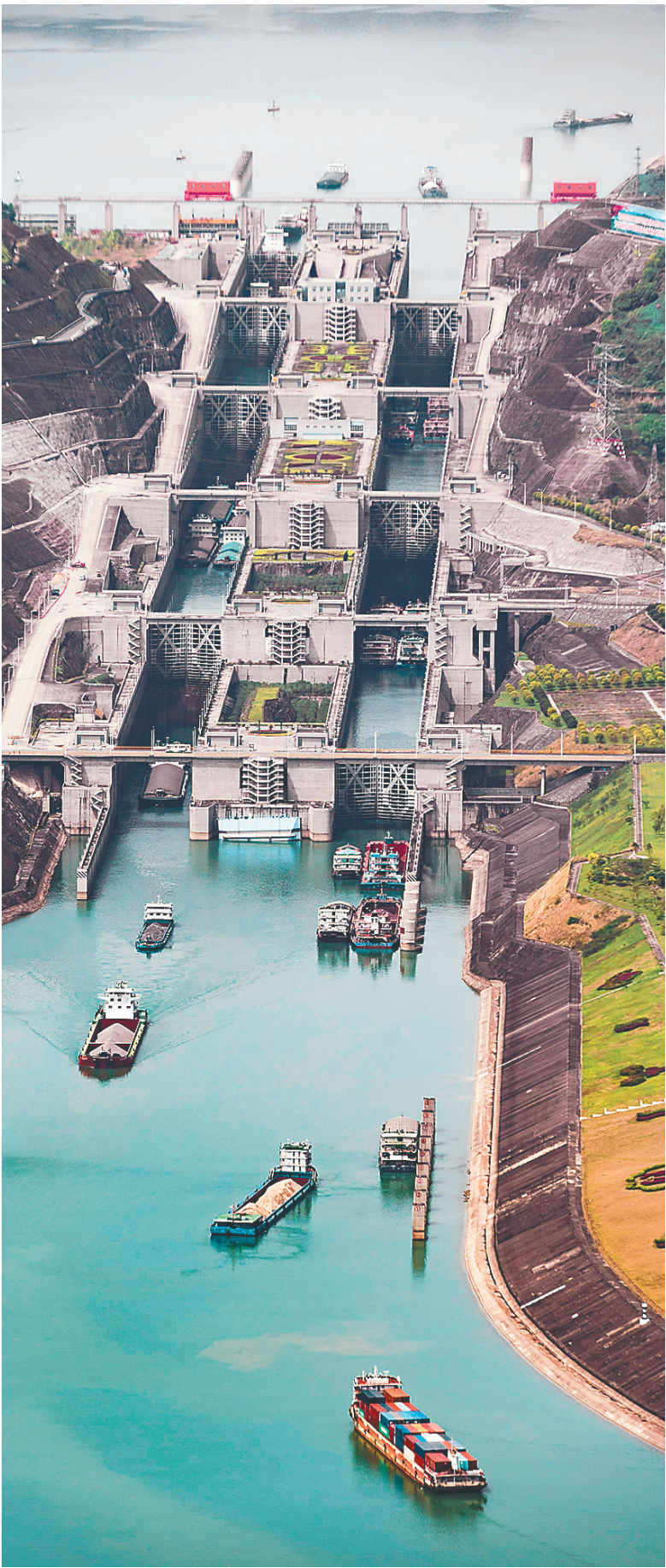
船舶有序通过长江三峡工程五级船闸。

6.8%——2018年一季度中国经济成绩单17日揭晓。一条稳健的增长线彰显新时代中国经济的韧性与活力——中国经济增长率连续11个季度稳定在6.7%到6.9%区间,稳中向好的发展背后,消费动力更加强劲,结构优化更趋明显。 实践已经并将继续证明,中国经济发展奇迹得益于改革开放。在新时代新起点上继续把全面深化改革开放推向前进,是中国经济迈向高质量发展的必由之路,也是实现中华民族伟大复兴的强大动力。