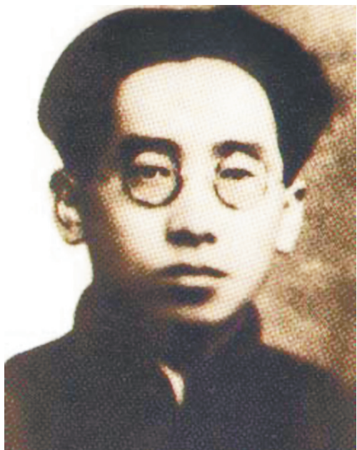
高君宇像(资料照片)。

据新华社太原4月17日电(记者霍璇)从太原市出发,往北百余公里就到了娄烦县静游镇峰岭底村,这里是中国共产党早期领导人、著名政治活动家高君宇的出生地,也是他16岁以前一直生活和学习的地方。 1896年10月,高君宇出生在当地一个有名望的大户人家。受父亲的影响,他思想活跃,赞成新生事物,向往变革与革命。 1916年,高君宇考入北京大学,参加各种进步社团,广泛接触有进步思想的老师和学生,在北大崭露头角,成为学生领袖。1919年参加领导了五四运动,带领学生上街游行,火烧赵家楼,痛打章宗祥,组织各校罢课,发表革命文章。 十月革命的影响,五四运动的锤炼,使高君宇更加坚定了马克思主义信仰和共产主义信念,自觉担当起在中国大地传播马克思主义的重任。1920年,他在李大钊的领导下发起组织马克思学说研究会,并在长辛店创办工人子弟学校,建立工人俱乐部和职工联合会,领导发动了北方早期的工人运动。1920年冬,高君宇加入北京的共产党早期组织。 1921年7月,中国共产党第一次全国代表大会在上海召开,高君宇是全国50余名党员之一。 1924年夏天,高君宇回到山西筹建共产党组织。1924年下半年南下广州担任孙中山先生秘书。1924年底陪同孙中山北上,协助进行国民会议促成会的筹备工作。1924年12月起任中共中央北方局委员。1925年3月5日在北京病逝,时年29岁。 “我是宝剑,我是火花,我愿生如闪电之耀亮,我愿死如彗星之迅忽。”——这是高君宇写在自己照片上的一首言志诗,也是他短暂而光辉的一生的真实写照。 当地的文保工作者李国成发掘,研究高君宇英雄事迹已经二十多年了。谈到这首革命诗歌,他动情地说:“伟大的信仰让高君宇充满力量,他因奔波不息积劳成疾,但却不顾个人安危,且随时准备为革命付出自己的生命。他如同闪电一般,划破旧世界的黑暗,悄然点亮中国的未来。”