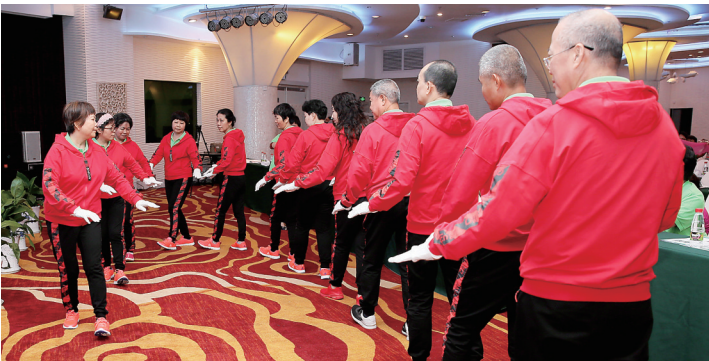
“抗癌战士”们以乐观精神和坚强毅力感染更多的人。图为癌症病友们在表演节目。