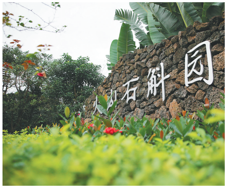
海口市秀英区施茶村石斛种植园。