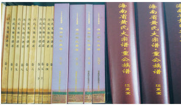
装帧不同的新修家谱。

无论是以家训明确下来的荣誉，还是对德行高尚者有几笔盖棺论定似的描述，如“好义名流”“勤俭持家”，都是写在纸上的一条精神脉络，熠熠生辉。在历史的长河中，逝者如斯，不变的是家谱中先人的遗训和风骨，经年累月也便成了家风。