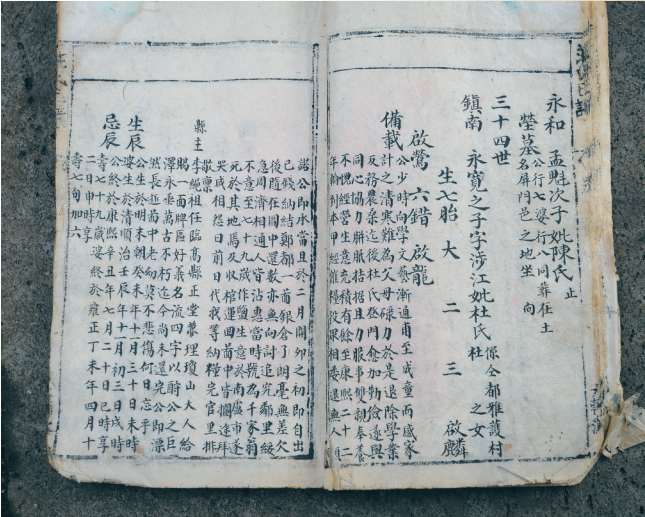
《庄氏族谱》关于庄镇南义举的记载。