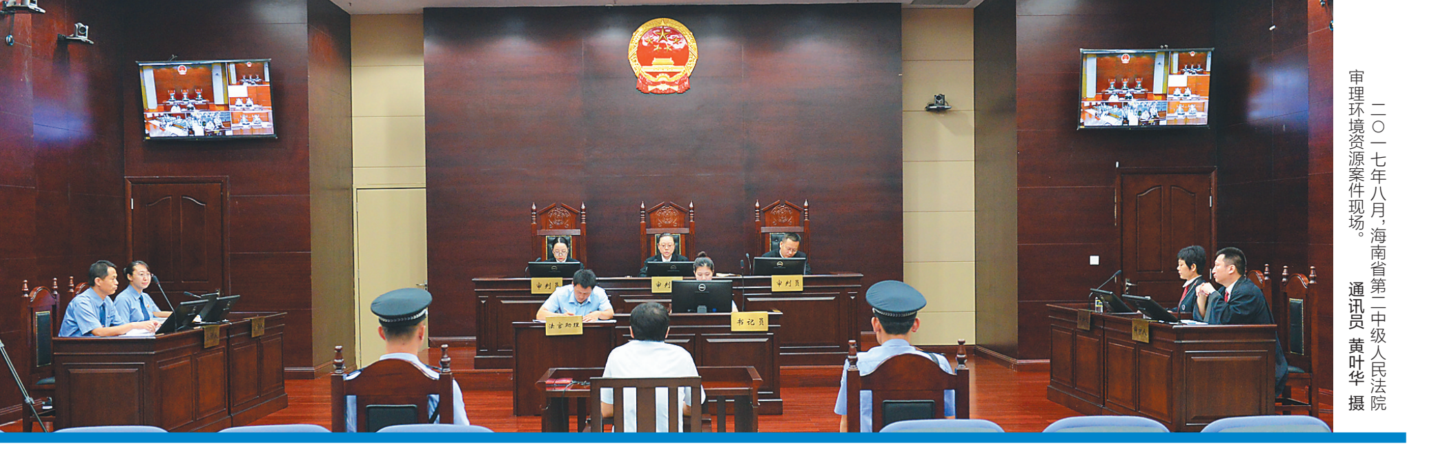
二〇一七年八月,海南省第二中级人民法院审理环境资源案件现场。

“树立正确的大局观,坚持围绕大局履职尽责,想中央所想、急中央所急,坚持一切工作必须围绕党中央决策部署来进行,自觉融入大局、服务大局、保障大局。” 最高人民法院院长周强这样阐释人民法院的“大局观”。 海南省高级人民法院党组书记、院长陈凤超表示,“为大局服务,为人民司法”是人民法院永恒的工作主题,海南法院只有站位全局、融入大局,把履行职责与服务大局结合起来,才能实现法院工作的历史使命。 30年来,海南法院紧紧围绕省委、省政府中心工作,坚持能动司法,主动研判形势,加强司法应对,始终确保法院工作与党委政府主张意图同频共振。 2009年,国际旅游岛建设上升为国家战略。海南法院迅速行动,先后出台了《服务海南国际旅游岛建设工作意见》、《审理商品房买卖合同纠纷案件指导意见》、《审理农村土地补偿款分配纠纷指导意见》等司法政策文件。 党的十八大以来,海南法院更是主动适应经济发展新常态,将“五大发展理念”贯穿执法办案全过程,依法保障全省改革发展大局。 服务重点工作—— 主动服务“多规合一”、三年拆违、海岸带整治,专程到最高人民法院第一巡回法庭协调相关工作。2017年,坚持法、理、情三结合,审结相关案件1309件; 全面参与全省禁毒三年大会战,2017年,审结毒品犯罪案件4818件,同比上升68.82%,依据最高人民法院命令执行了一批罪大恶极的毒犯死刑,形成极大威慑; 支持配合全省深化监察体制改革试点工作,主动提出建议,做好刑事诉讼衔接配套工作。 服务经济转型升级—— 立足全域旅游发展,大力推广三亚旅游巡回法庭经验,海口四区法院同时挂牌成立旅游巡回法庭,文昌法院设立航天城特色旅游巡回法庭。 认真执行海南省“两个暂停”的房地产调控政策。2017年,审结房地产纠纷案件7295件。