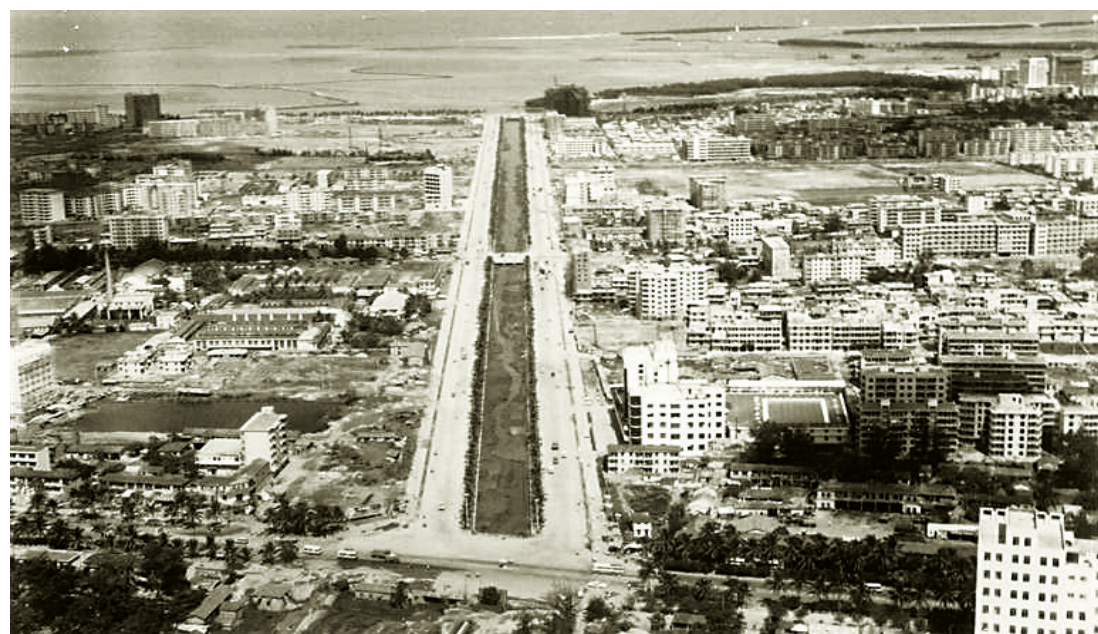
1987年,海口市龙昆北路。