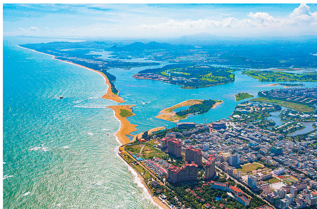
2016年的博鳌滨海景观。