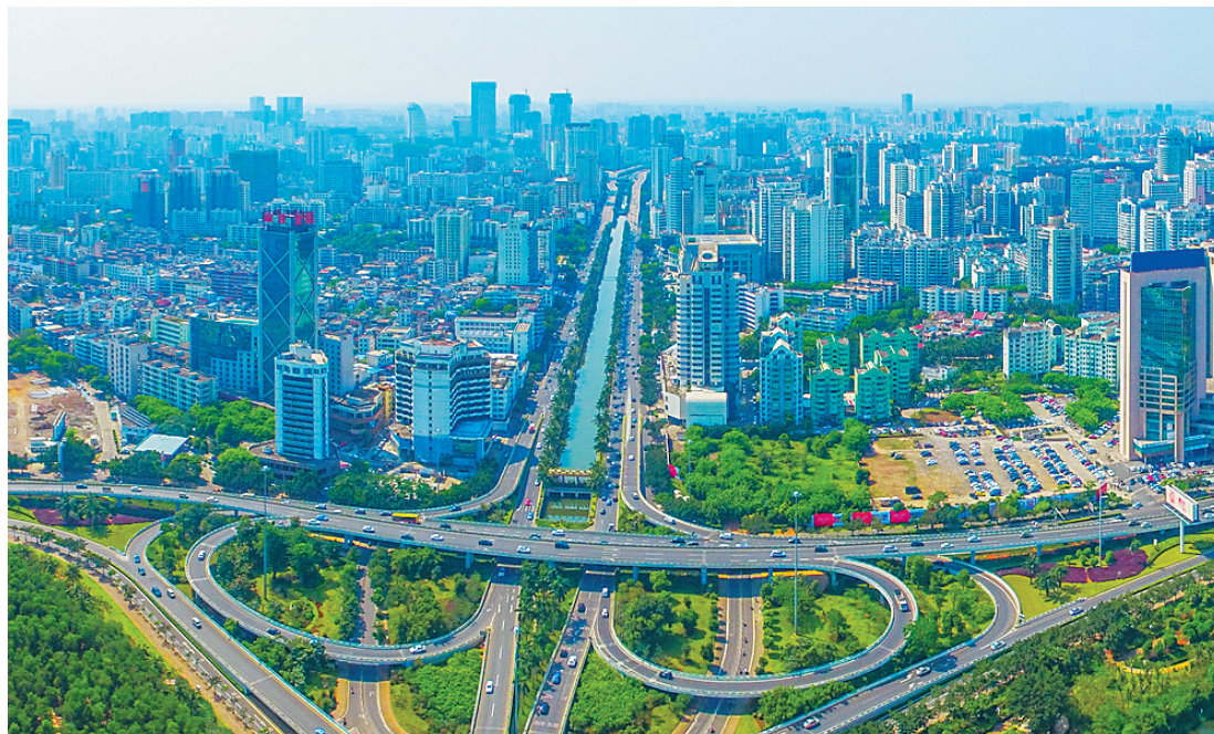
2017年,海口市龙昆北路。