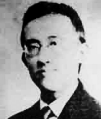
杨闇公像（资料照片）。

“在国际舞台的合作是中印关系的重要组成部分。两国坚定维护以联合国宪章为基础的国际关系基本准则，在国际事务中许多理念相近。”中国国际问题研究院副研究员蓝建学说。 中国在处理大国关系时，坚持战略自主，坚持不冲突不对抗，坚持推动建设相互尊重、公平正义、合作共赢的新型国际关系。这同中印两国上世纪50年代共同倡导的和平共处五项原则一脉相承。 “从上海合作组织到金砖国家，从二十国集团到东亚峰会，中印两国在多边场合保持密切沟通协调，开展务实合作，维护发展中国家共同利益，推动国际政治经济秩序朝更民主和合理方向发展。”胡仕胜说。 专家认为，作为两个亚洲大国，中印为推动地区经济发展作出积极贡献。随着孟中印缅经济走廊建设的不断推进，两国在带动区域经济一体化和互联互通建设方面还有很大的合作空间。 “这次会晤中，中印发出进一步加强国际和区域合作的响亮声音，对于推动世界多极化和经济全球化向前发展，共同打造稳定、发展、繁荣的21世纪亚洲有着重要意义。”钱峰说。 （新华社北京4月28日电）