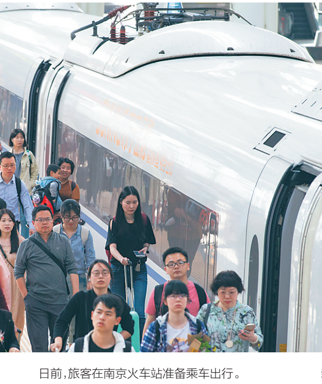
日前，旅客在南京火车站准备乘车出行。

扎兰屯的赏花专列，同时对哈齐高铁4对动车组列车进行重联运行，增加运输能力，缓解城际间出行客流压力。武汉局集团公司加开列车234趟，将20趟列车重联开行的方式扩充运力，重联开行列车运力比日常增加一倍。西安局集团公司开行“参加采摘游，体验劳动美”旅游列车，在汉中、宁强等方向增开8对高铁列车，并推出“高铁+公路”联运模式，服务“五一”期间中国西乡茶叶樱桃采摘体验文化旅游活动。成都局集团公司加开成都东至沙坪坝、永川东、峨眉山、乐山、广安南等方向动车组28对，方便旅客旅游出行需求。 “五一”假期客流量较大，铁路部门提示，已通过互联网、电话成功预订但尚未取票的旅客，请尽量提前取票；乘车时请携带车票及与票面信息一致的有效身份证件，尽量提前出门，为安检、取票、验票进站等留足时间，以免耽误行程。