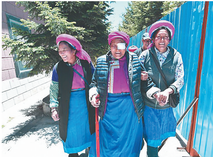
截至目前,海航“光明行”活动开展15年来,帮助国内外7000余名白内障患者重见光明。图为2017年5月,海航“光明行”走进云南香格里拉。