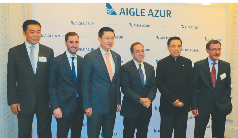
腾飞 2012年10月23日,海南航空收购法国蓝鹰航空48%股权,开创内地航空公司入资欧洲航空企业的先河。

1993年5月2日,身披海南特色“鹿回头”标识的B737-300客机满载着海南人民和海航人的蓝天梦想展翅腾飞。从这一天算起,海航人开启了25载艰苦奋斗的峥嵘岁月。