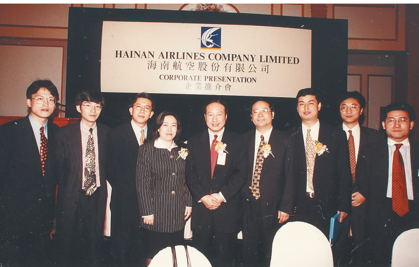
展翼 1997年6月26日,海南航空股份有限公司7100万B股在上交所挂牌,海航成为首家境内外上市外资股的民航运输企业。