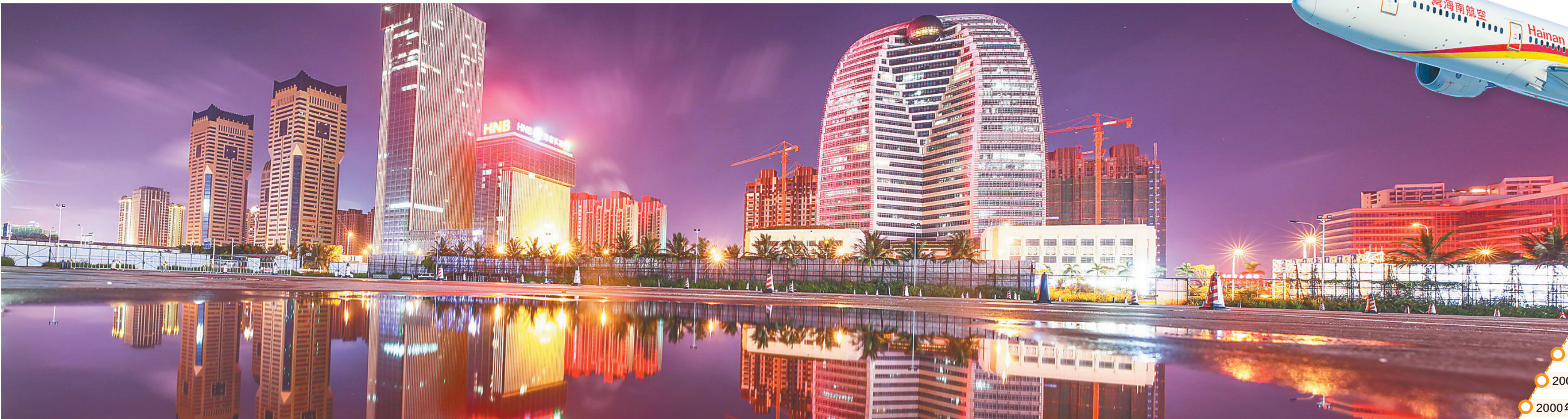
位于海口大英山CBD的海航大厦展现华丽颜值。