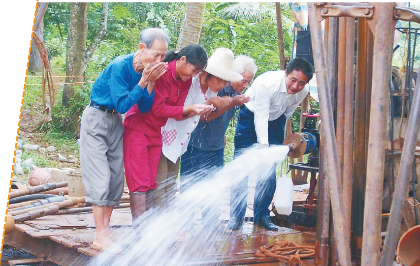
截至目前,海航集团投入2000万元,为海南缺水地区修建100口至善井,有效解决了近30万人的饮水难问题。图为“至善井”竣工出水后,当地群众前来饮水用水。