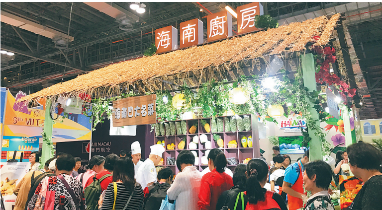
“海南厨房”亮相澳门。

省旅旅游委国际与港澳台市场推广处调研员杨黎明表示,随着我省旅游产业的迅速发展,希望通过以港澳民众的兴趣点——美食为媒,展示优