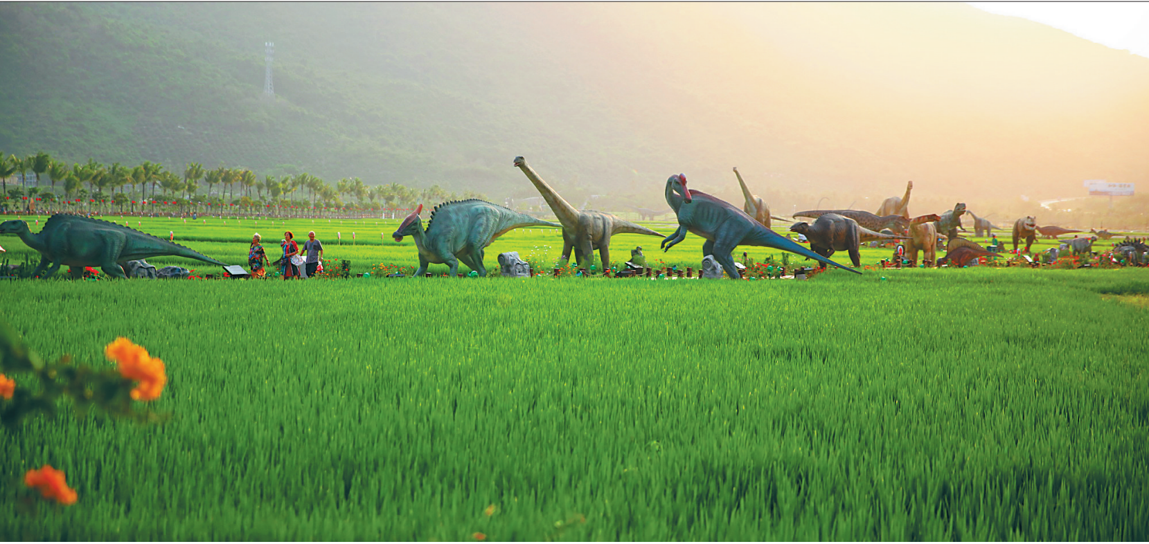
三亚海棠湾水稻公园。