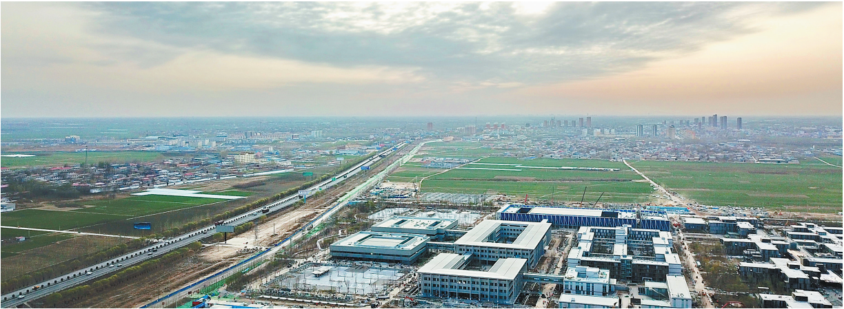
春天的雄安大地一派生机盎然景象(无人机拍摄)。

4月10日,在博鳌亚洲论坛上谈到未来的开放举措时,习近平主席说,“我们将尽快使之落地,宜早不宜迟,宜快不宜慢”。 4月11日,中国人民银行、中国证监会、国家外汇局等金融部门就迅速向社会公布了开放的具体举措。 ——资本市场开放新动作引人注目。沪港通、深港通5月1日起每日交易额度扩大4倍;允许外资控股合资证券公司;争取年内开通沪伦通;上海和深圳两地QDLP和QDIE试点额度将分别增加至50亿美元…… ——推动银行业开放措施落地。取消银行和金融资产管理公司