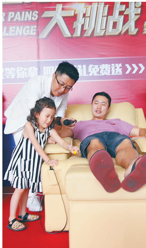
一名女孩在为体验分娩阵痛的爸爸打气。

据了解,该活动已连续举办了两届,有累计超过百万人通过现场、微信、微博、直播平台等方式参与并关注。