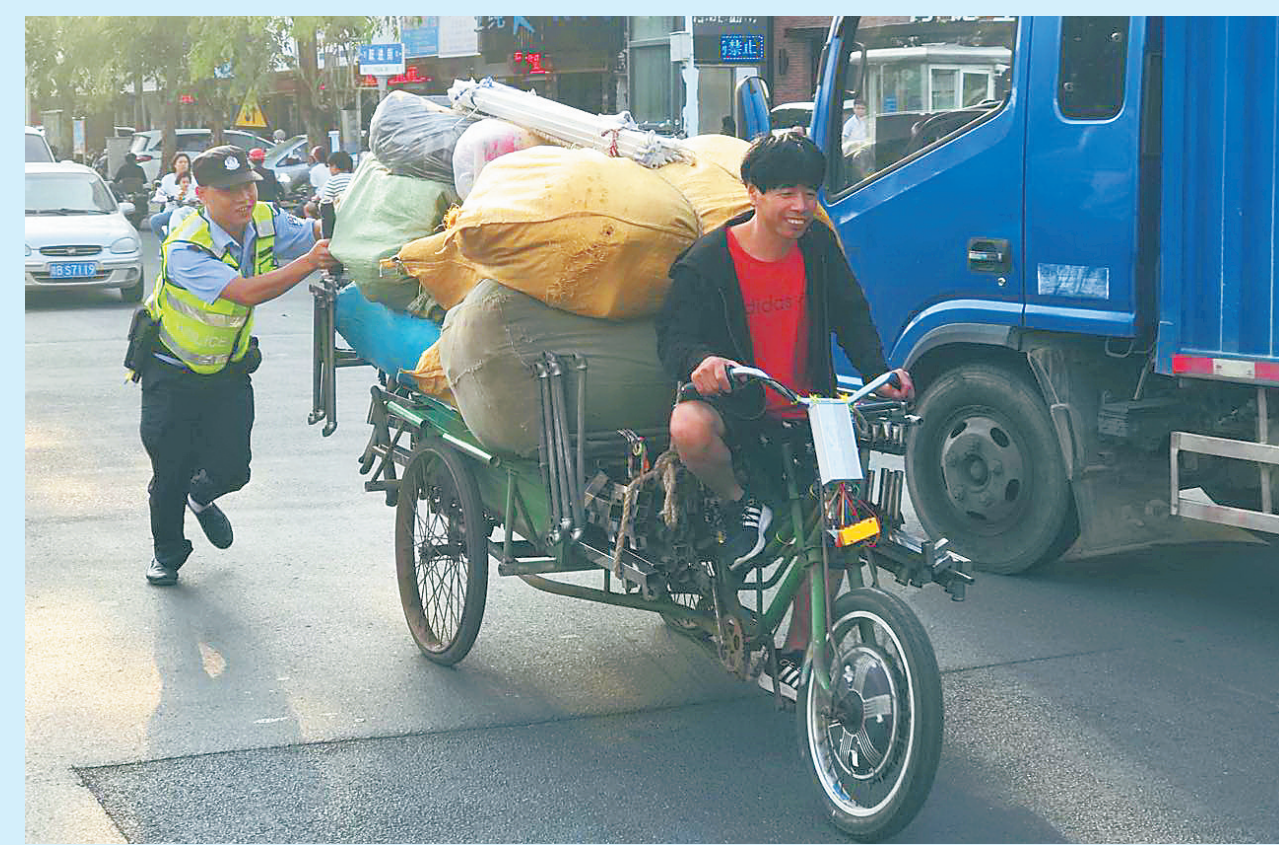
路管员帮群众将一辆装满货物的三轮车推过马路。