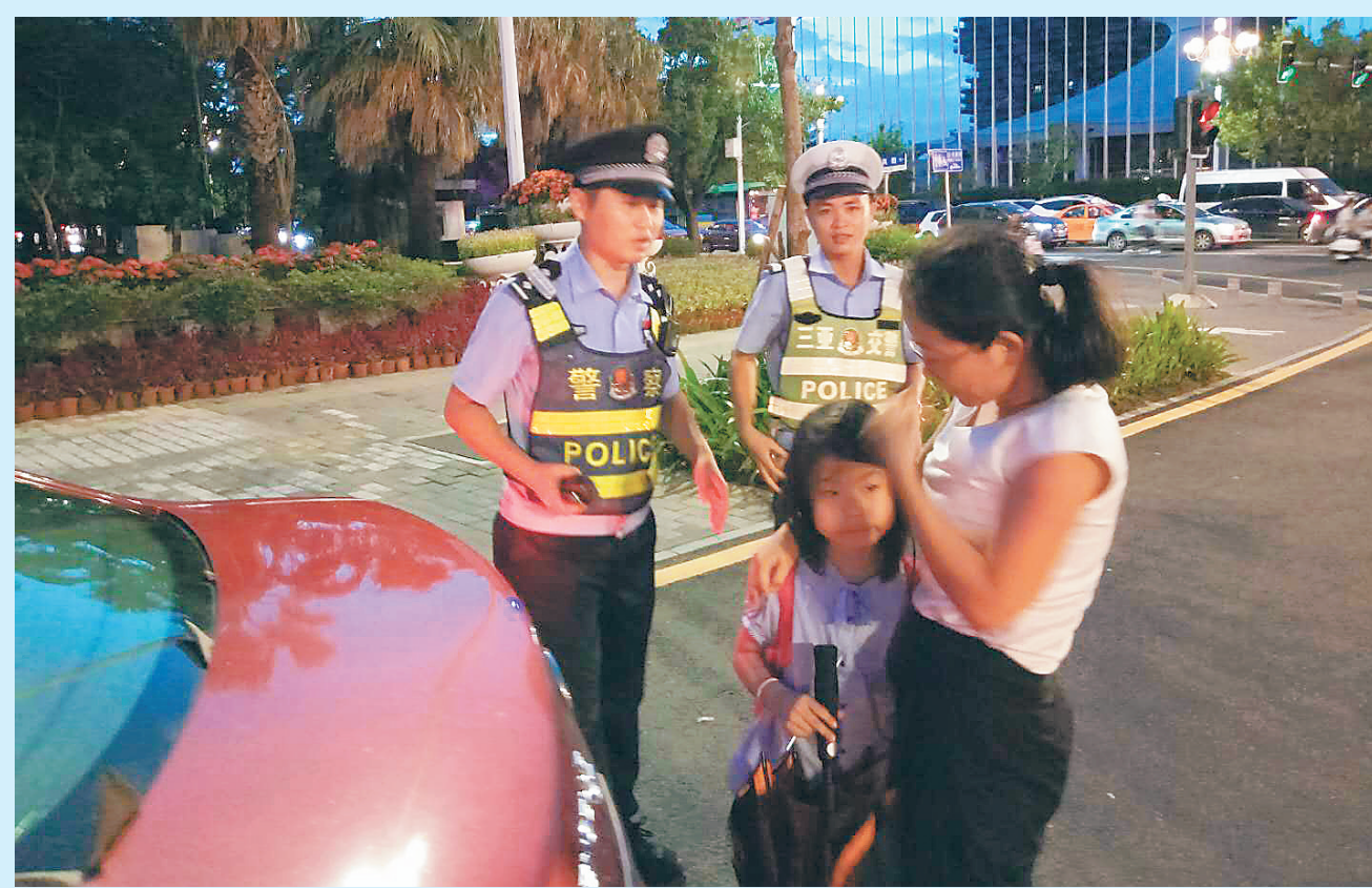
路管员帮群众找回走失小孩。