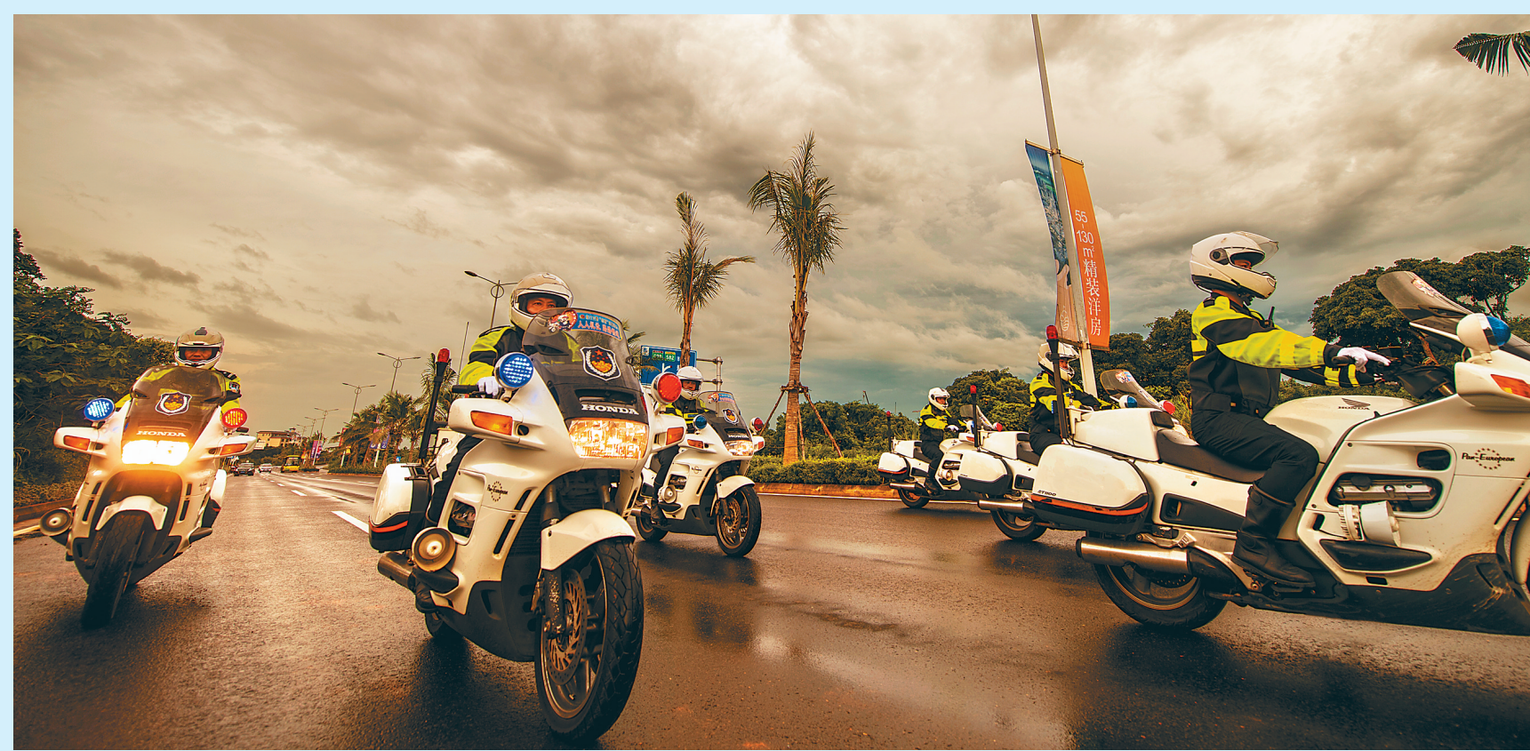
正在巡逻的交警。

习近平总书记在庆祝海南建省办经济特区30周年大会上宣布支持海南全岛建设自由贸易试验区、支持海南逐步探索、稳步推进中国特色自由贸易港建设的信息让每一个海南人倍感振奋。 面对深化改革开放浪潮，海南公安交警如何扬帆起航，肩负起神圣的新使命？ “以人民为中心，以改革为引领，努力提升公安交管现代治理能力和水平，努力由自由贸易试验区、自由贸易港建设提供安全畅通有序的交通环境，不断满足人民群众便捷服务和品质服务并重的新需要。”省公安厅交通警察总队队长孙赫给出了坚定的回答。