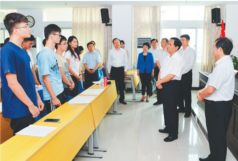
五月四日，省委书记刘赐贵到海南大学调研。图为在海南大学马克思主义学院，刘赐贵勉励青年学生深入学习贯彻习总书记重要讲话精神，让青春在建设美好新海南中焕发光彩。