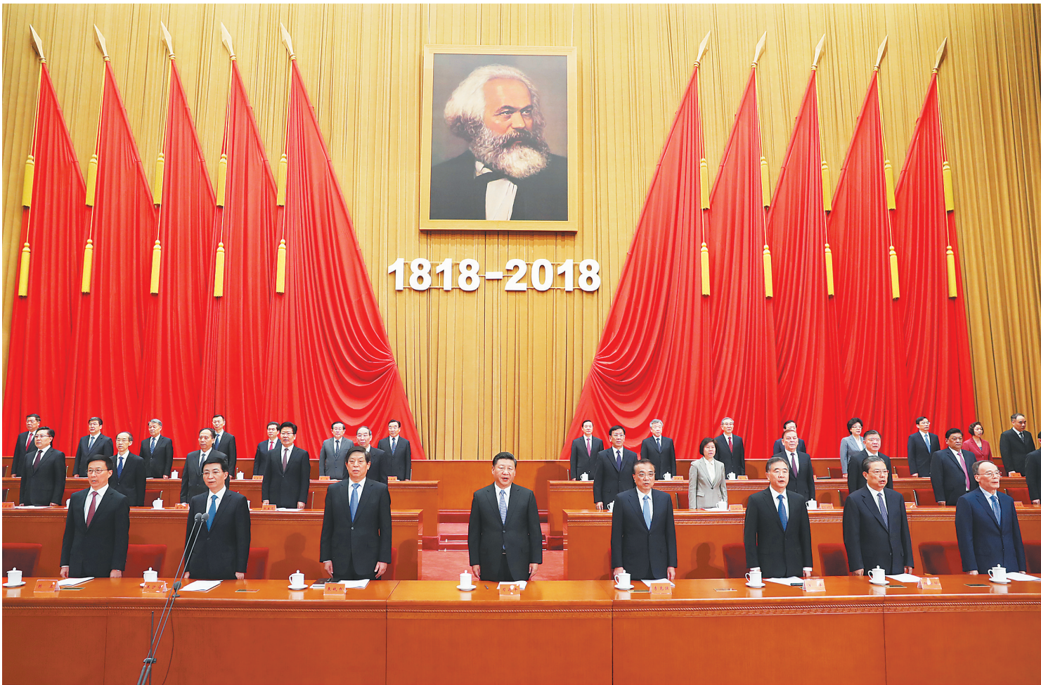
5月4日，纪念马克思诞辰200周年大会在北京人民大会堂隆重举行。习近平、李克强、栗战书、汪洋、王沪宁、赵乐际、韩正、王岐山等出席大会。

新华社北京5月4日电 (记者张晓松 黄小希)纪念马克思诞辰200周年大会4日上午在北京人民大会堂隆重举行。中共中央总书记、国家主席、中央军委主席习近平在会上发表重要讲话强调，我们纪念马克思，是为了向人类历史上最伟大的思想家致敬，也是为了宣示我们对马克思主义科学真理的坚定信念。马克思主义始终是我们党和国家的指导思想，是我们认识世界、把握规律、追求真理、改造世界的强大思想武器。新时代，中国共产党人仍然要学习马克思，学习和实践马克思主义，高扬马克思主义伟大旗帜，不断从中汲取科学智慧和理论力量，更有定力、更有自信、更有智慧地坚持和发展新时代中国特色社会主义，让马克思、恩格斯设想的人类社会美好前景不断在中国大地上生动展现出来。