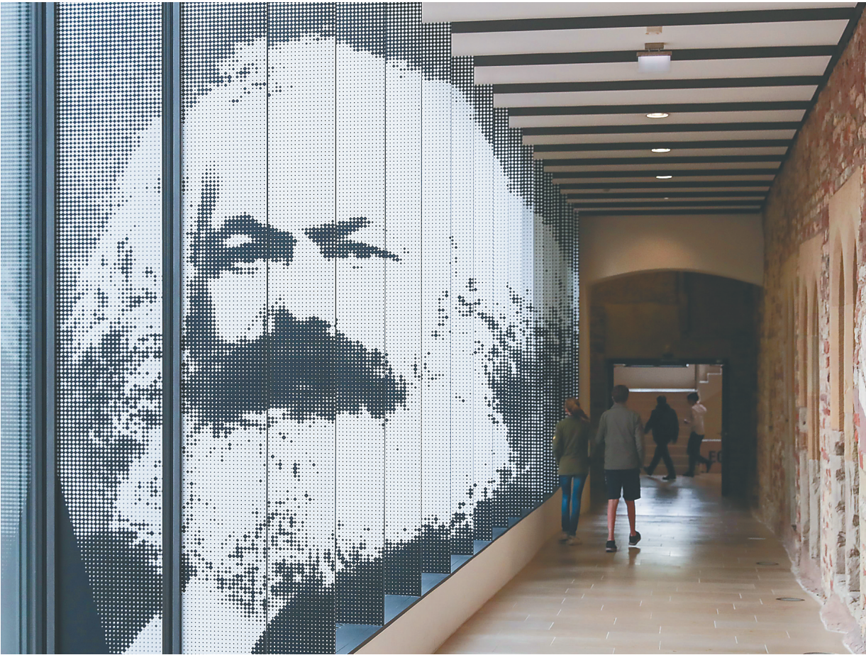
5月3日,德国特里尔市立西麦翁博物馆马克思主题展入口。

首批10卷,共计600万字! 2015年启动的《马藏》编纂工程,计划在2018年交出首份“成绩单”。 “搜集汇集与马克思主义中国化相关的各类文献,这项工程预计需要20年才能完成。”在北京大学教授、《马藏》编纂与研究中心主任顾海良看来,其规模宏大、卷帙浩繁,充分展示了马克思主义博大精深、影响深远。 两个世纪过去了,人类社会发生了巨大而深刻的变化,但马克思的名字依然在世界各地受到人们的尊敬,马克思的学说依然闪烁着耀眼的真理光芒! 这是一座思想的丰碑。 在人类思想史上,就科学性、真理性、影响力、传播面而言,没有一种思想理论能达到马克思主义的高度,也没有一种学说能像马克思主义那样对世界产生如此巨大的影响。 时间回溯到19世纪40年代。 批判地继承德国古典哲学、英国古典政治经济学、法国空想社会主义,汲取细胞学说、能量守恒和转化定律、进化论等最新科学成果……马克思主义不仅是千百年来人类优秀思想文化智慧结晶,更是时代发展到一定阶段的必然产物。 无论是敌视者的攻讦诽谤,还是误解者的歪曲责难,都阻挡不了马克思主义的巨大真理威力。在不断发展的时代潮流面前,辩证唯物主义和历史唯物主义的世界观方法始终焕发强大生命力。 在西方,英国广播公司第四频道调查3万听众,征询“古今最伟大哲学家”,马克思位居第一。同年,马克思在德国被评为“德国最伟大人物”。 青年时期树立崇高理想、30岁与恩格斯合作写下《共产党宣言》、历经40年写作《资本论》,马克思为着真理孜孜以求,“除了崇拜真理,他不知道还要崇拜别的”。 对自己热爱的工作和事业,马克思曾这样表达内心:我已经把我的全部财产献给了革命斗争,我对此一点也不感到懊悔。相反地,要是我重新开始生命的历程,我仍然会这样做…… 没有一位思想家能像马克思那样,以博大情怀,时刻关注和思考人类的命运;以深刻洞察,从人类生活的基本事实即物质资料的生产入手,揭示人类社会的发展规律;以凌云之志,投身于人类的解放事业,在革命斗争实践中检验自己的理论、探索人类解放的道路。 连日来,马克思的故乡举办一