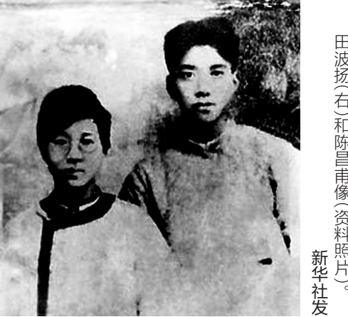
田波扬(右)和陈昌甫像(资料照片)。

据新华社长沙5月5日电(记者刘良恒)暮春,草木葳蕤,夏意渐浓。怀着无比崇敬之情,记者来到位于湖南浏阳市北盛镇泉水村,瞻仰田波扬、陈昌甫烈士墓。 田波扬,1904年3月出生,湖南浏阳人。早年在长沙读书期间,结识了郭亮、夏曦、夏明翰等进步青年,1923年5月加入中国共产党。 1926年3月退学回到长沙,以教师身份作掩护,组织工农群众和青年学生支援北伐战争。1926年6月起,田波扬先后任共青团湖南省委宣传部长、团省委书记。1927年到武汉出席党的五大。他在会上发言支持毛泽东、蔡和森、瞿秋白等人的正确意见,批评右倾机会主义错误,主张反抗国民党新军阀的屠杀政策。 陈昌甫,女,1905年6月出生,湖南浏阳人。1921年与田波扬结婚。1923年到长沙求学,不久加入中国社会主义青年团,1926年加入中国共产党。1927年春任共青团湖南省委联络员,协助田波扬工作。他们夫妇被誉为“生活的亲密伴侣,工作的革命同志,斗争的真挚战友”。 1927年5月21日,国民党反动军官许克祥叛变革命,制造了“马日事变”。5月30日晚,由于叛徒告密,田波扬、陈昌甫夫妇等8位同志被捕。敌人对田波扬施以酷刑,用竹签扎进他的十指,用木杠压断他的双腿,要他自首和说出党的秘密。七天七夜死去活来的摧残折磨,田波扬始终威武不屈:“头可断,血可流,此志不可移!”“我走的道路是光明正大的,不需要悔悟!” 1927年6月6日凌晨,残暴的敌人枪杀了这对年轻的革命夫妻。田波扬牺牲时年仅23岁,陈昌甫牺牲时年仅22岁,且怀有身孕。