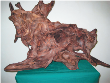
海南黄花梨天然根系作品。