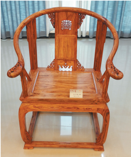
海南黄花梨新料制作的皇宫椅。

随着王世襄先生的《明式家具研究》出版，人们认识到中国最好的明式家具是用海南黄花梨制作的。一些嗅觉敏锐的商人由收购收藏明式家具，转而收购囤积海南民间的普通黄花梨家具和原材料，以致海南民间尚存的一些旧料和小料，甚至连陈旧的门窗料、农具料都几乎收购殆尽。从此，“深藏乡野人不识”的海南黄花梨，重新回归人们的视野。