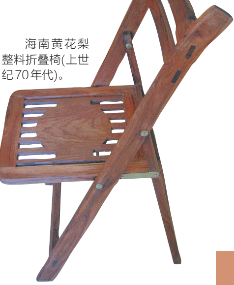
海南黄花梨整料折叠椅(上世纪70年代)。

案告破。这个由邻县8名不法分子组成的犯罪团伙，分工具体，组织严密，专门偷盗锯伐海南黄花梨树，短短半年时间，就在全省流窜疯狂作案80余起，案值粗略估算上千万元。