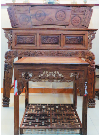
海南黄花梨制作的供台和八仙桌。

黄花梨的材质： 海南黄花梨密度为0.82—0.94克/立方厘米，少数根料或结疤较大的材料会入水即沉，多数会显现半浮半沉，或者完全浮出水面。黄花梨富含油性，毛孔细小，材质致密，具有一定的柔韧性和很强的稳定性，常温常态下基本不变形、不开裂、不蛀虫，是最适合雕刻凿锼的木材之一，也很容易打磨抛光。即使是原木，把玩盘磨一段时间后，也会显得油光锃亮，温润如玉，甚至会有荧光感、琥珀质感等，不上漆不打腊也很好看，因而是制做家具和雕刻工艺品的首选木材。（陆明）