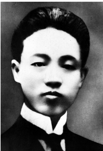
赵世炎像（资料照片）。

据新华社上海5月7日电 “龙华授首照丹心，浩气如虹烁古今，千树桃花凝碧血，工人万代仰施英。”在《忆赵世炎烈士》一诗中，老一辈无产阶级革命家吴玉章高度评价了我国著名的工人运动领袖赵世炎同志。“施英”正是赵世炎在党和工会刊物上写文章时用的笔名。 1901年，赵世炎出生在四川西阳（今属重庆市）。父亲感受到那个时代的世态炎凉，希望他的小儿子能够像一团火一样去照亮这个世界，故给他取名“世炎”。