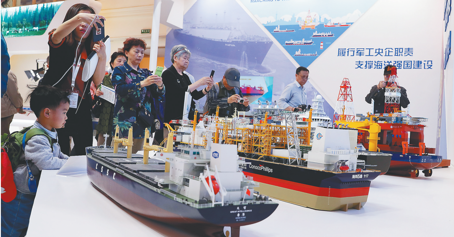
参观者在中国船舶工业集团展位参观。

据新华社上海5月10日电 2018年中国品牌日活动5月10日在上海拉开帷幕。 日前,中共中央政治局常委、国务院总理李克强就加强品牌建设作出重要批示。 批示指出:加强品牌建设,增加优质供给,是实现高质量发展、更好满足人民群众对美好生活需要的重要内容。近年来,在各方共同努力下,我国品牌建设取得积极进展。新形势下,各地区、各部门要以习近平新时代中国特色社会主义思想为指导,认真贯彻落实党中央、国务院决策部署,坚持以推进供给侧结构性改革为主线,立足我国实际,借鉴国外经验,深入实施创新驱动发展战略,促进提高全要素生产率和企业综合竞争力,以大众创业、万众创新和“互联网+”汇聚各方面力量,瞄准人民群众的新需要和不断升级的市场需求,着力增品种、提品质、创品牌,弘扬企业家精神和工匠精神,使更多中国品牌伴随中国制造走向世界、享誉世界。