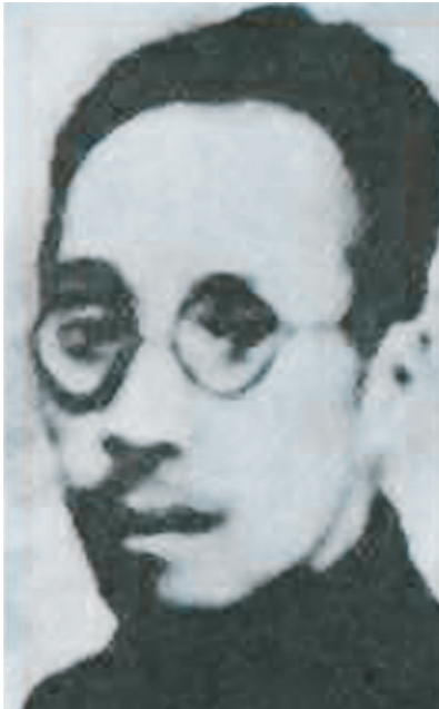
王荷波像(资料照片)。

据新华社福州5月10日电(记者刘娟)在众多为国捐躯的革命英烈中,王荷波的名字也许鲜为人知。然而,这位中国工人运动的先驱、中国共产党早期领导人之一,他的人生经历、他对中国革命的贡献、他“品重柱石”的共产党员本色却永垂青史。 王荷波,原名王灼华,1882年出生于福州。1916年,王荷波考入天津铁路南段的浦镇机厂。1922年6月加入中国共产党。不久,浦口党小组成立,王荷波是负责人之一。在他的组织领导下,很快成立了浦口铁路工会。王荷波严以律己,公私分明,从不乱花大伙一文钱,深得工人群众的信赖。在他40岁生日时,工友们送他一块大红绸,上面写有“品重柱石”四个大字。 1923年6月,王荷波赴广州出席党的第三次全国代表大会,并当选为中央执行委员。9月,王荷波被增补为中央局委员。1925年1月,王荷波在上海参加了党的四大,当选为中央候补执行委员。同年2月,王荷波当选为中华全国铁路总工会委员长;5月,当选为中华全国总工会执行委员。1927年3月,王荷波与周恩来、罗亦农等一道组织领导了上海工人第三次武装起义。5月,党的五大在党的历史上第一次选举产生了中央监察委员会,王荷波当选为首任主席。 1927年八七会议上,王荷波当选中央临时政治局委员,并担任北方局书记。会后,被派往北京领导北方党的工作,他拟定了工人武装起义计划,秘密建立北京总工会,发展会员。由于叛徒出卖,王荷波于10月18日被捕。11月11日,王荷波被军阀张作霖下令枪杀,壮烈牺牲,时年45岁。