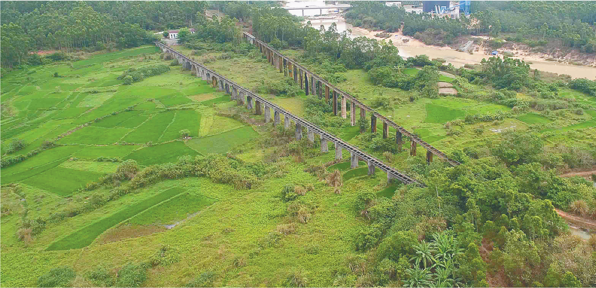
春江水利丰润万亩良田

5月7日,在儋州市王五镇春江水库附近,纵横交错的水利系统滋润着下游的农田。据介绍,近些年来,当地政府大力兴修水利工程,完善水利灌溉系统,为周边的万亩农田提供了充足的农业用水,促进了当地农业的发展。