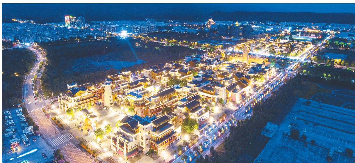
俯瞰北川新县城巴拿恰商业街夜景(5月10日无人机拍摄)。

5月11日，在枣强县第三小学，消防人员辅助学生现场体验氧气面罩。 当日，河北省枣强县第三小学组织开展“防灾减灾校园行”主题实践教育活动，向学生普及防灾减灾知识，提高学生灾害避险自救能力。