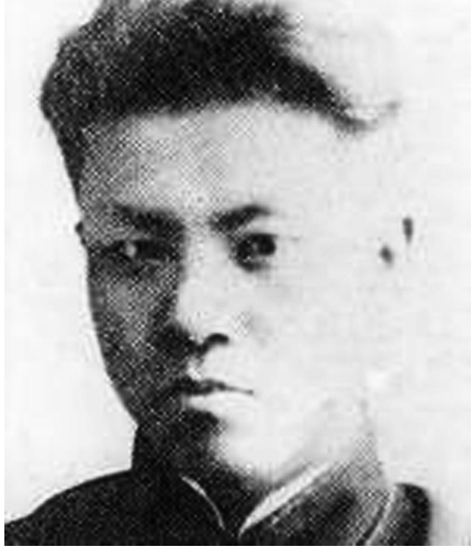
于方舟像(资料照片)。

据新华社天津5月15日电(记者尹思源)于方舟原名于兰渚,1900年9月15日生于直隶省宁河县(现为天津市宁河区)侯口村一个农民家庭。1917年秋,于方舟考入天津直隶省第一中学。中学时期,于方舟面对神州破碎、民不聊生的凄惨景况,自警道:“狂澜四面严相逼,群生彼岸须毋亟。方舟负一何重?方舟遭境一何逆?”遂以“方舟”为名,以此自奋,愿做“渡人之舟”,把祖国人民从水深火热中拯救出来。