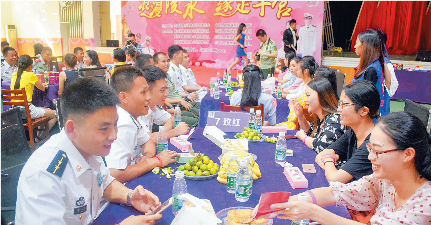
陵水黎族自治县致力于打造军民融合发展示范基地。图为陵水组织地方优秀女青年和部队青年军官举行联谊活动。