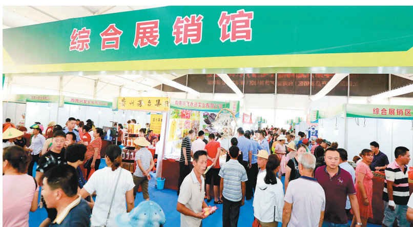
农博会综合展销馆。