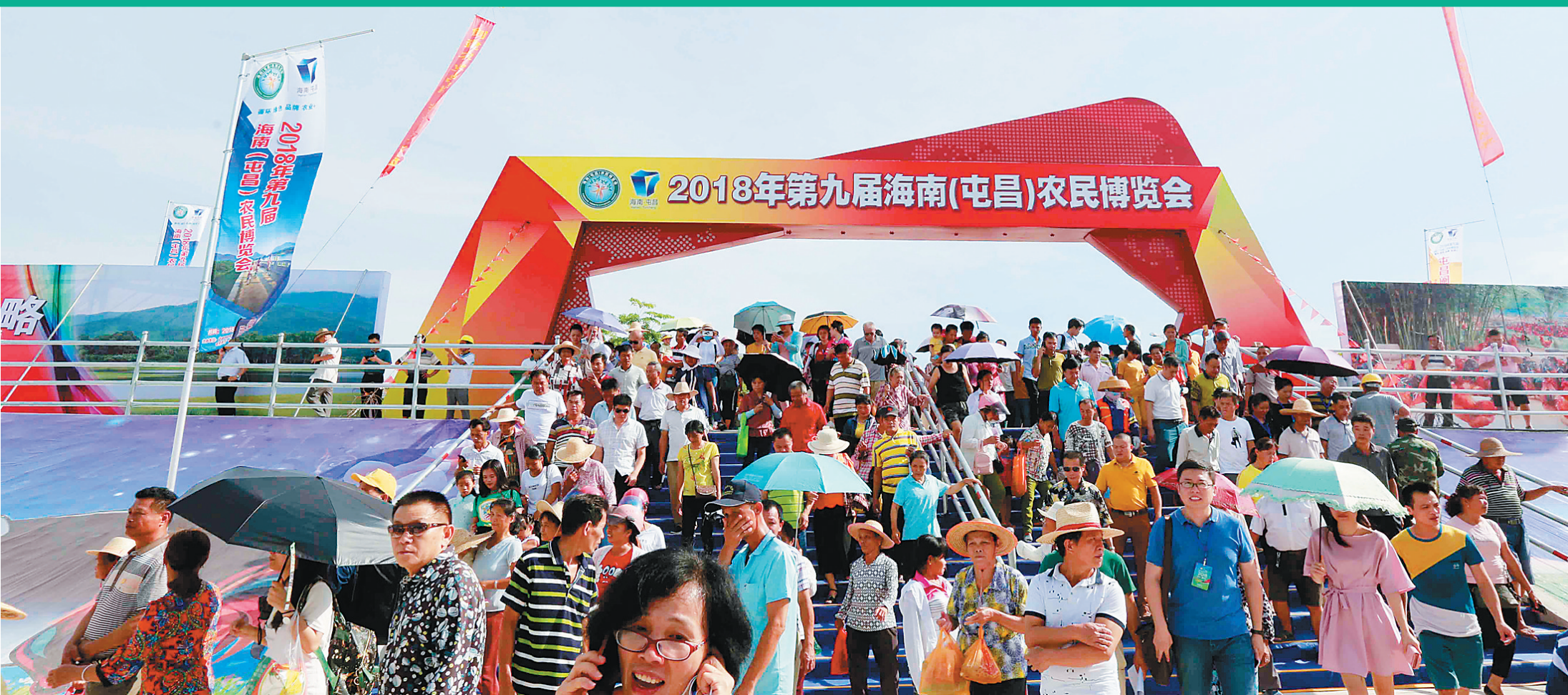
5月18日,2018年第九届海南(屯昌)农博会开幕。