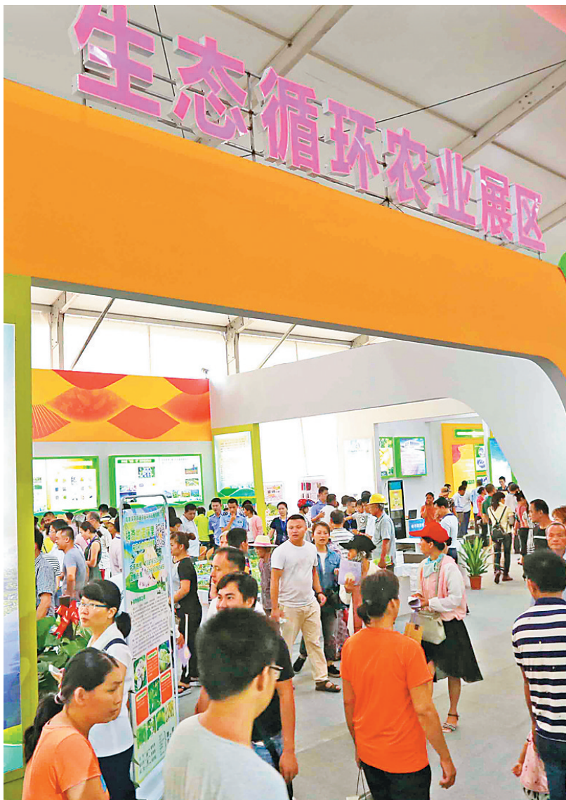
农博会生态循环农业展区。