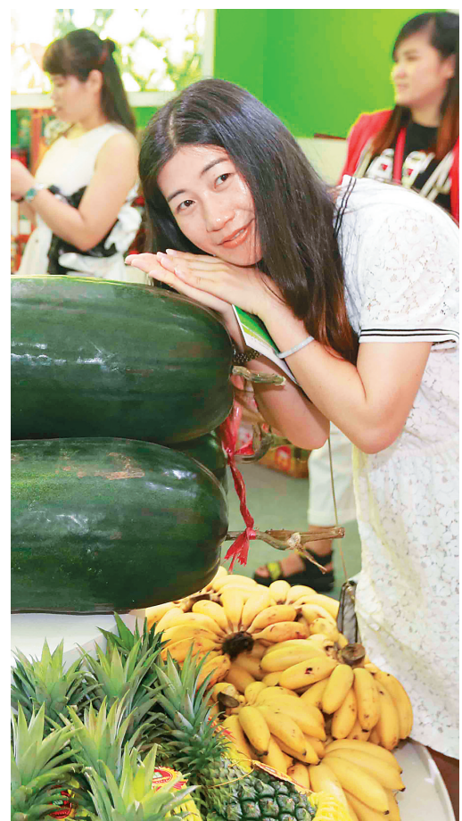
游客在农博会上拍照留念。