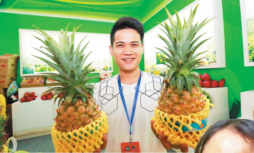
农博会上,工作人员展示菠萝。