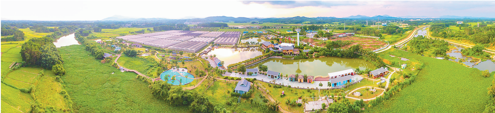
屯昌农博会分会场——猪哈哈的农场。

先进的经营理念,助力农业增收,而独特优美的自然风光,则为农庄持久经营的重要吸引力。必须在守住生态底线的基础上,用好各类政策加快推进共享农庄的落地以及开工建设。”屯昌县政府相关负责人表示,该县在发展共享农庄时,不仅要求守住乡村的青山绿水、生态环境资源,同时还加快水网、路网、网络、乡村公厕等基础设施的建设,提升农民安居幸福指数。