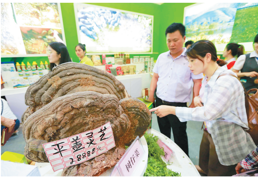
农博会上展示的灵芝。