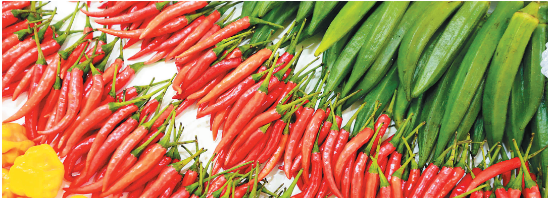
农博会上展示的农产品。