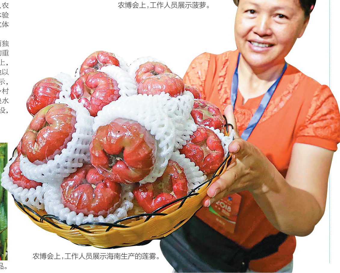
农博会上,工作人员展示海南生产的莲雾。