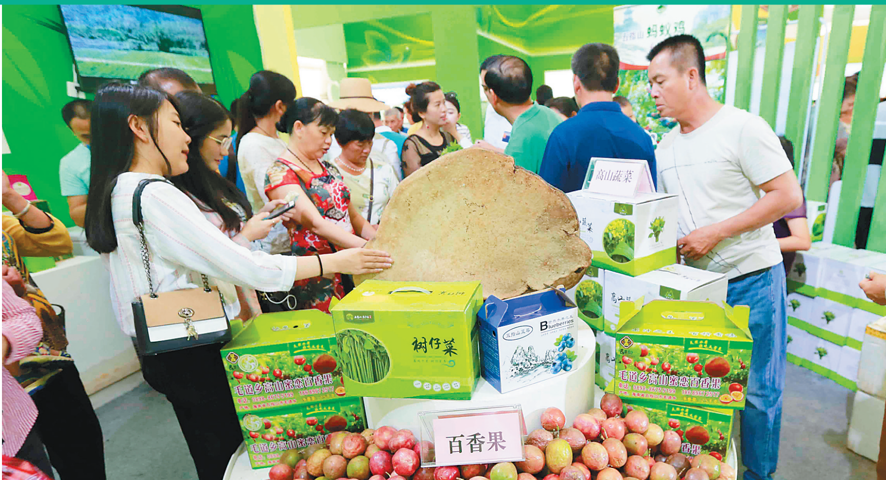
农博会吸引了众多市民游客参观。