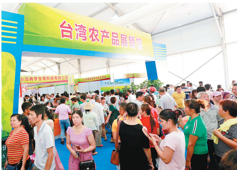
农博会台湾农产品展销馆。