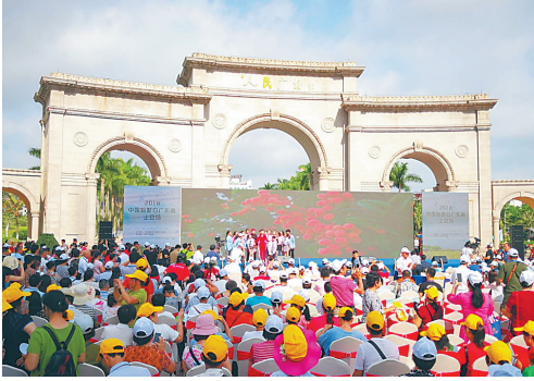
5月18日,茂名第二届旅游博览会开幕。

本报茂名5月18日电（记者徐一豪 海报集团全媒体中心记者李金波）鸡鸣犬吠、稻耕犁田……今天上午,伴随着田园气息浓郁的开场表演,2018中国旅游日广东省主场系列活动暨茂名第二届旅游博览会在“好心之城”茂名拉开序幕。粤桂琼三省媒体、两广三十城游客齐聚茂名,共同开启茂名乡村旅游大幕。 本届旅博会为期3天,以“乡约广东,村暖花开”为主题,由广东省旅游局、茂名市人民政府、茂名市旅游协会主办,茂名日报社、茂名国旅、茂名市旅游服务中心承办。活动吸引了来自两广地区的100余家企业、近万人参展参会。 据介绍,本届旅博会设有旅游金融与交通、旅游景区与酒店、旅游超级卖场、两广旅游手信、寻味茂名、旅游万花筒等功能展区,为市民游客提供旅游资源展示、优惠旅游产品销售等服务。 展会期间,还将开展“十大美丽乡村”夏日乡村游首发仪式、“两广三十城、万人游茂名”系列团首发仪式、粤桂琼三省(区)十二市党报赴茂名旅游采风、旅游行业跨界嘉年华等十大主题活动,掀起乡村旅游热潮。 “此次旅博会聚集各地特色资源,是茂名参展旅游企业数量最多、展览规模最大、旅游文化及产品展示最完全的区域性旅游专业博览会。”活动组委会相关负责人介绍。 开幕式上,2017茂名十大美丽旅游乡村评选结果揭晓并获授牌。开幕式结束后,“两广三十城、万人游茂名”活动首批游客及粤桂琼媒体采风团向茂名“十大美丽乡村”进发,逛千年荔枝园“贡园”,游“高峡平湖”玉湖风景区、冼太夫人故里,一路领略乡村风光,感受大美茂名。 茂名市位于广东省西南部,南临南海,旅游资源非常丰富。近年来,该市积极推进旅游供给侧结构性改革,提升旅游品质、扩大开放合作,致力于开发滨海旅游和乡村旅游,尤其是乡村旅游蓬勃发展,涌现出了许多精品乡村旅游景点,成为茂名旅游业发展的一大新亮点。