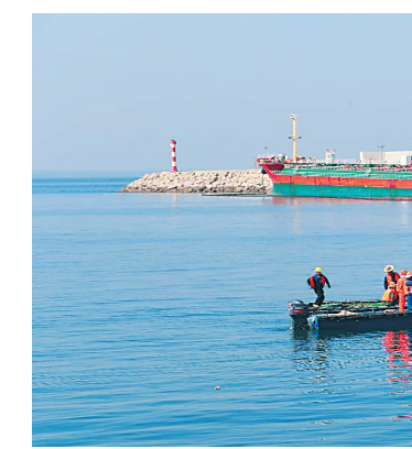
海南炼化成品油码头工作人员在引导小鲸鱼游回深海。

本报海口5月18日讯（记者计思佳 郭芊 叶媛媛）日前,有媒体报道,海口市美兰区大致坡镇、琼山区三门坡镇农户种植的菠萝出现了滞销的情况。记者从海口市农业局获悉,海口已启动为期一个月的菠萝爱心售卖活动,通过电商销售、菜篮子集团收购、进社区和超市促销等方式为农户打开销路。今后,海口农业部门将引导农户科学种植,逐步淘汰旧的菠萝品种,提高海口菠萝产业的市场竞争力。