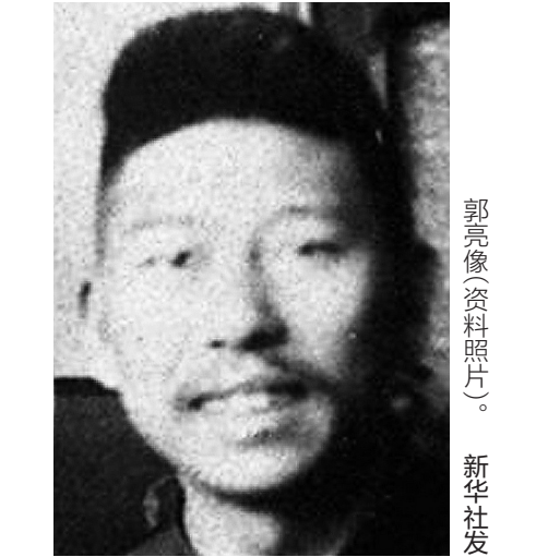
郭亮像（资料照片）。

据新华社长沙5月20日电（记者刘良恒）郭亮，又名靖嘉，湖南长沙人，1901年12月3日出生。郭亮是毛泽东的亲密战友，毛泽东在延安谈起郭亮时，赞扬郭亮是“有名的工人运动的组织者”。