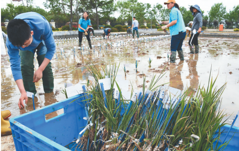
5月20日，技术人员在青岛海水稻研发中心盐度试验田扩繁区内插秧。