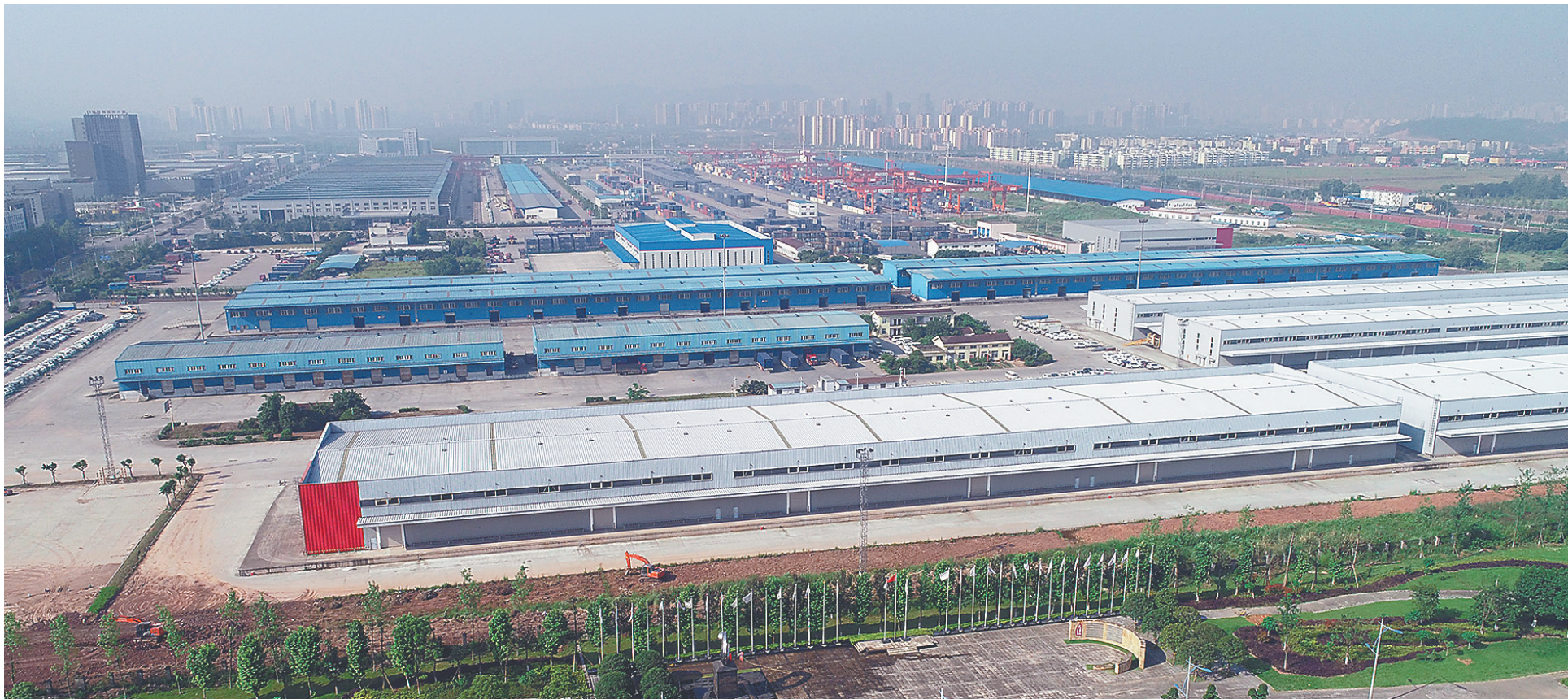
高空鸟瞰位于重庆自贸区西永片区的重庆西部物流园。这里不仅是丰趣海淘等多个知名跨境电商企业的物流仓储基地,也是中欧班列(重庆)的起点。

目前,重庆市渝中区的自贸板块悄然进行着零售转型升级。作为位于重庆自贸试验区内唯一的商圈,解放碑中央商务区进行了进口分销体系建设,让市民在家门口就可以买到更多更实惠的进口商品。