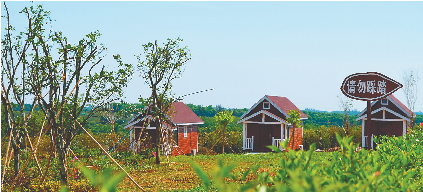
红明农场公司荔海共享农庄。

来到农庄另一处景点——荔香湖。湖水清澈,荷叶摇曳多姿。在湖面的另一侧,是6栋精致的木屋别墅。