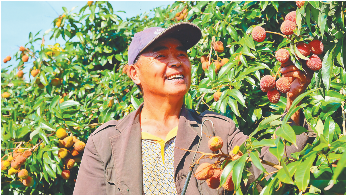
红明农场公司职工在采摘荔枝。

“农场种植荔枝20年,种植管理技术日益成熟,产量逐年提高,品质不断提升,价格越来越‘坚挺’。”红明农场公司党委书记、董事长王波表示,要提升