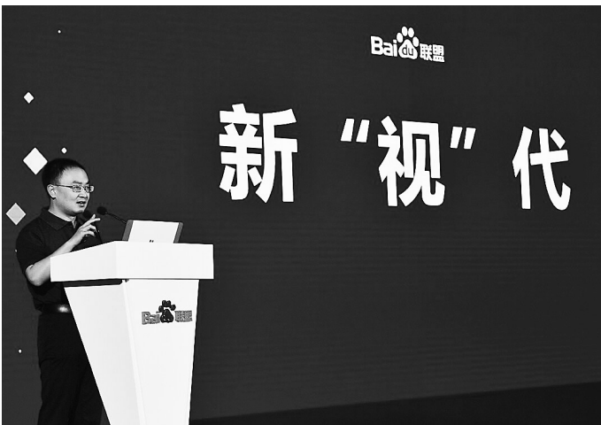
百度高级副总裁、百度搜索公司总裁向海龙。

未来计划”，利用先进科技手段让更多孩子共享优质教育资源，帮助更多的孩子用知识实现他们的梦想。 据悉，作为“2018百度联盟生态峰会”联合主办方之一，海南生态软件园将以此次大会为契机，携手百度开展多项深入合作，从战略投资、政务服务、产业服务、城市生活服务等多方面赋能百度生态系合作伙伴。向海龙表示，今年是我国改革开放40周年，也是海南建省办经济特区30周年，尤其近期中央宣布海南全岛建设自由贸易区，探索建设中国特色自由贸易港，百度希望通过此次联盟峰会让更多优秀创业者在海南找到新机遇。