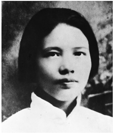
向警予像(资料照片)。新华社发

据新华社长沙5月24日电(记者柳王敏)向警予(1895—1928)，原名向俊贤，女，湖南溆浦县人。中国共产党早期重要领导人之一，杰出的共产主义战士，忠诚的无产阶级革命家，中国妇女运动的先驱。